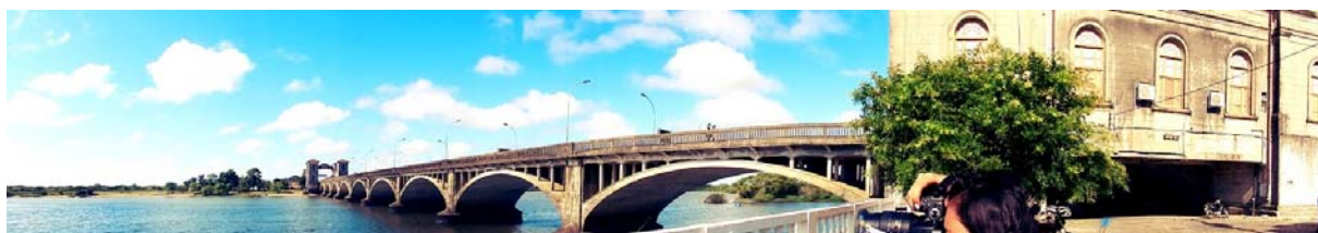
Figura 2 – Ponte Internacional Jaguarão-Rio Branco. Foto: Eduardo Rocha, 2016.

A partir da observação das fotos dos viajantes, podemos apontar que assim como a casa torna-se casa quando tem a abertura da porta, a ponte torna-se morada no ato do demorar-se dos passageiros que capturaram várias fotos da paisagem sobre a ponte, embaixo dela e em seus arredores. A ponte une dois territórios, duas realidades, que estariam separadas pela imensidão do rio, tal como afirma Fernando Fuão (2012) “a abertura do túnel dá o sentido, o sentimento”. Não existe interioridade sem abertura ao estrangeiro. A abertura é condição da hospitalidade o encontro entre o que está dentro e o que está fora, é o que dá passagem à vida.