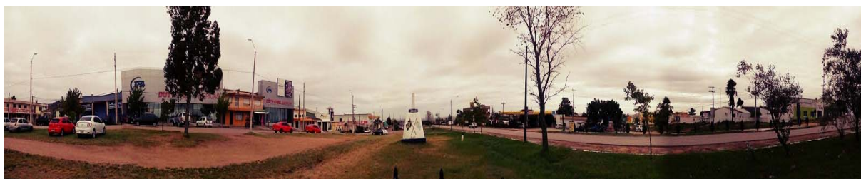
Figura 4 – Linha de fronteira Aceguá-Acegua.