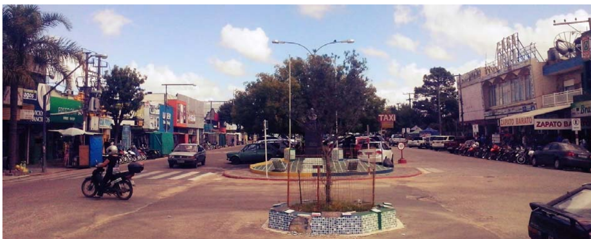
Figura 5 – Linha de fronteira Chuí-Chuy. Foto: Gustavo Reginato, 2016.

Enquanto a fronteira Santana do Livramento-Rivera é o oposto, uma cidade agitada, que tem como linha de fronteira uma praça internacional local de densidade de acontecimentos, edifícios, pessoas, sons e cheiros – a ebulição da fronteira. Essa tensão é a sensação do limite como junção. Existem algumas características urbanas que conseguem tornar mais fácil a percepção de em qual país nos encontramos. As ruas do lado Brasileiro são mais estreitas e agitadas, enquanto do lado Uruguaio são largas vias, com um movimento mais tranquilo e um tratamento diferenciado no desenho urbano das esquinas.