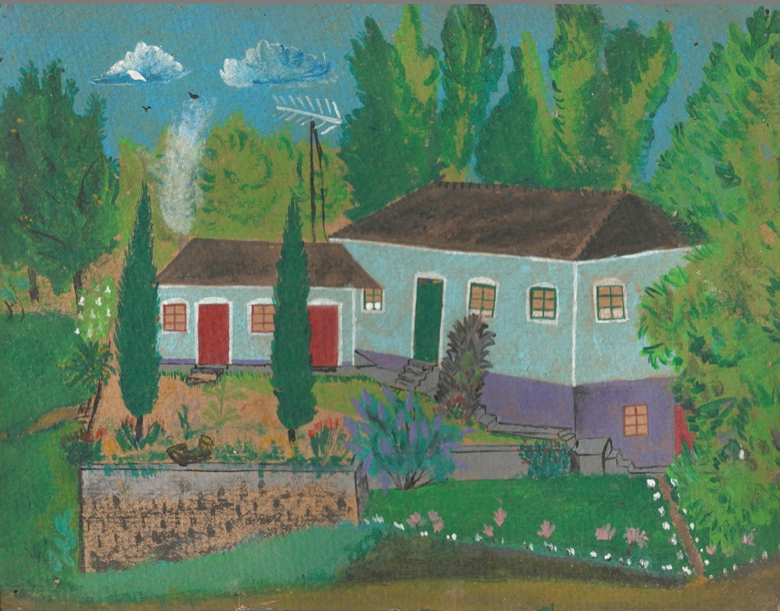
Por Cleuza Schiavon. Recordação da antiga casa. Janeiro de 1978.