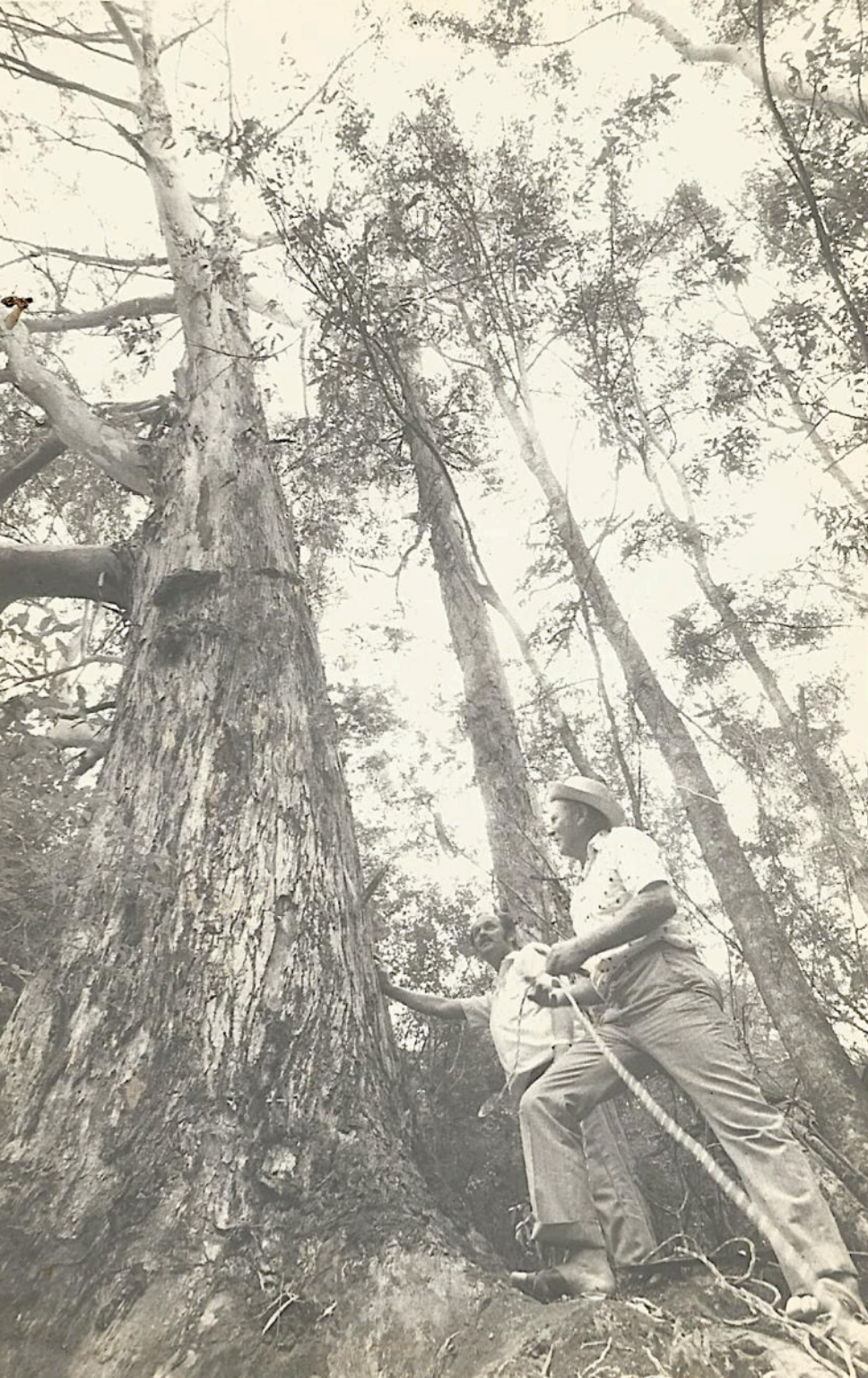
Seu Izídio e o vizinho, 1970. Eucalipto, patrimônio natural, conservado por mais de 100 anos.