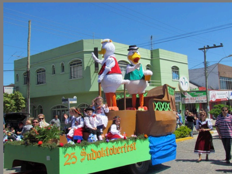
Desfile de rua