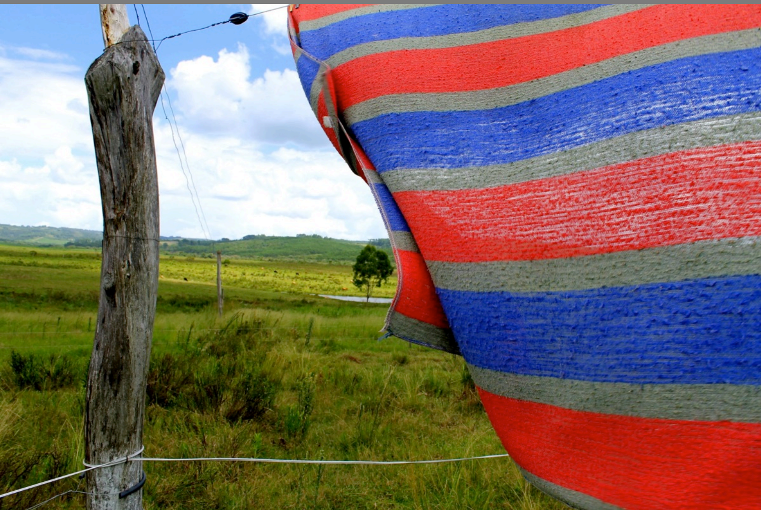
Assentamento de Reforma Agrária Doze de Julho.