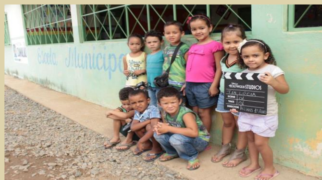
Figura 13 – Alunos da Educação Infantil e 1º Ano frente a Escola.

Os recursos materiais utilizados para o desenvolvimento das atividades foram: caixa de som amplificada, microfone, data show, HD externo com os filmes, câmera filmadora e fotográfica, aparelho de celular, claquete, folhas de papel sulfite, lápis de colorir, cola branca e lápis grafite.