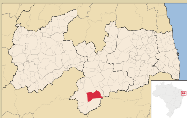
Figura 1 - Localização de Camalaú na Paraíba