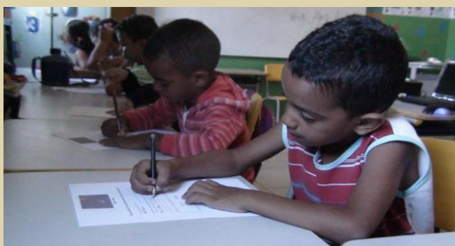
Figura 9 – Alunos respondendo ao Questionário de Aprimoramento de Conhecimento.