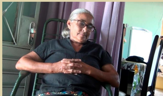
Figura 12 – Frame do Documentário “Tia Lúcia”.