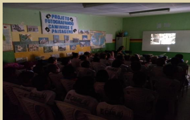
Figura 14 e 15 – Exibição de filmes, sala do 5º Ano (Cineclube)

conceber e pôr em prática situações e procedimentos para motivar e engajar os alunos nas aprendizagens; construir e aplicar procedimentos de avaliação formativa de processo ou de resultado que levem em conta os contextos e as condições de aprendizagem, tomando tais registros como referência para melhorar o desempenho da escola, dos professores e dos alunos; selecionar, produzir, aplicar e avaliar recursos didáticos e tecnológicos para apoiar o processo de ensinar e aprender; criar e disponibilizar materiais de orientação para os professores, bem como manter processos permanentes de formação docente que possibilitem contínuo aperfeiçoamento dos processos de ensino e aprendizagem; manter processos contínuos de aprendizagem sobre gestão pedagógica e curricular para os demais educadores, no âmbito das escolas e sistemas de ensino (BNCC, 2018, p.16/17).