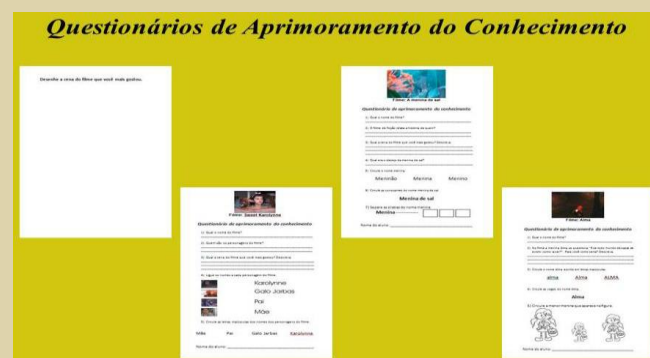
Figura 7 – Questionários de Aprimoramento de Conhecimento.