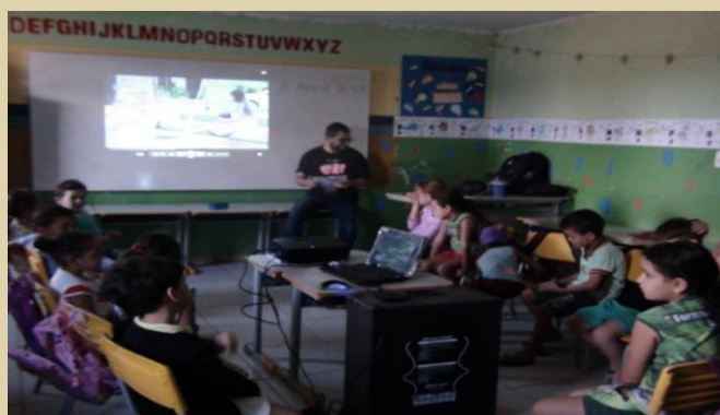
Figura 5 – Roda de Conversa sobre o filme exibido.