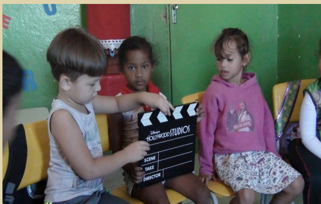
Figura 8 – Manuseio dos equipamentos.

manuseio tanto na sala como na parte externa da escola, quando saíram para praticar registro fotográfico no entorno da comunidade. Foi formado um círculo com as cadeiras na sala de aula, após uma explanação oral sobre a função que cada equipamento daquele exercia na hora de realizar as gravações do um filme de documentário ou ficção. O filme exibido nesse dia foi “Alma”, de André Moraes 4 ; roda de conversas; produção do desenho da cena que mais gostou e; questionário de aprimoramento de conhecimento.