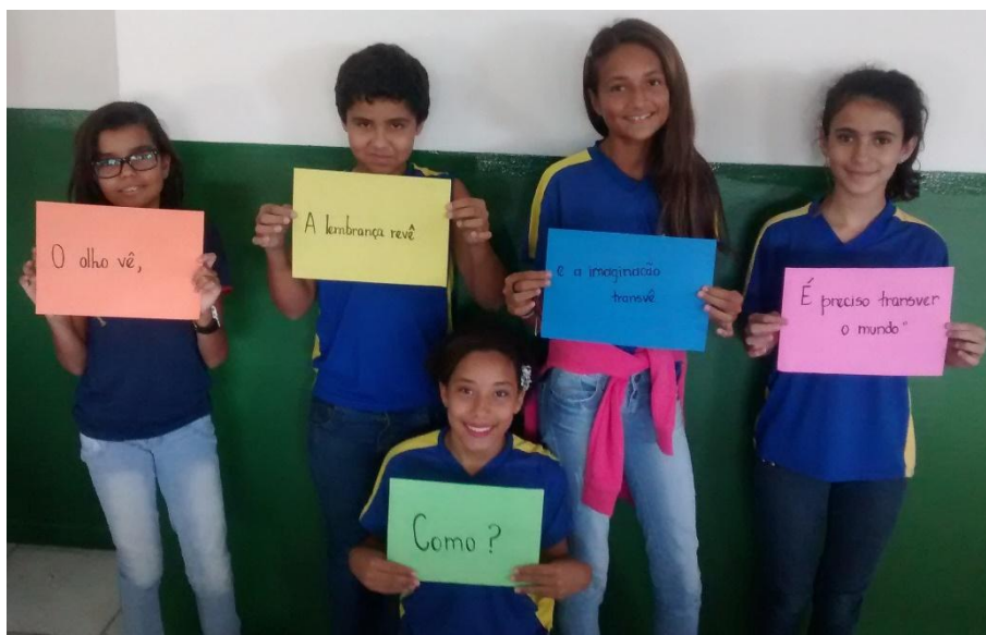
Figura 4 Slides apresentados na introdução do vídeo

transver o mundo; como?”, transformando-se em um vídeo para cada uma das turmas.