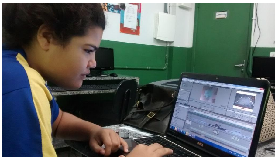
Figura 5 Processo de edição do vídeo

O processo de edição dos vídeos foi orientado por mim e realizado por uma aluna que possuía maior domínio com as ferramentas disponíveis no editor Adobe Premiere.