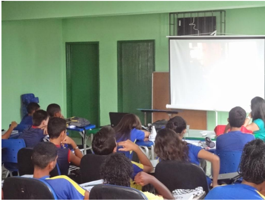
Figura 1 Alunos assistindo ao documentário junto com a professora regente

Em um segundo momento os educandos assistiram e debateram o documentário “Só Dez por Cento é Mentira”, Pedro Cezar, 78 minutos, que explora a “biografia inventada” e versos fantásticos do poeta sul-mato-grossense Manoel de Barros, alternando sequências de entrevistas inéditas do escritor, versos de sua obra e depoimentos de “leitores contagiados” por sua literatura.