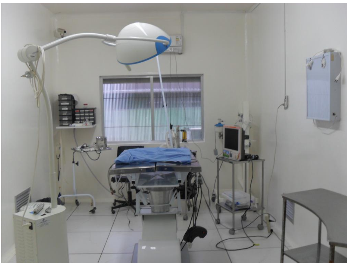
Figura 1. Sala operatória I do bloco cirúrgico de animais de companhia do HCV – UFPel. A sala apresenta mesa cirúrgica, foco cirúrgico, aparelho de anestesia inalatória portátil HB Slin e monitor multiparamétrico Dixtal 2020 .

O setor de cirurgia do HCV – UFPel é constituído pelo pós operatório, pré operatório e bloco cirúrgico, onde este apresenta duas salas operatórias (figura 1) e uma sala para as disciplinas de Clínica Cirúrgica I e II.