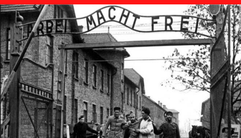
Portão de um campo, lê-se "O trabalho liberta".