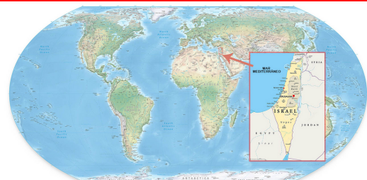
Região da Judeia, atualmente.

A Alemanha encontrava grandes dificuldades econômicas, a muito tempo a população em geral ficava descontente com o povo judeus alemão por continuar o comércio mesmo com dificuldades. Hitler se aproveitou do populismo para criar um ódio coletivo contra os judeus, ele tinha o objetivo de tornar a Alemanha um país rico para o povo ariano , para isso considerava necessária a eliminação de povos que não eram "puros", na sua visão. Assim tem início o antissemitismo nazista, também chamado de Holocausto.