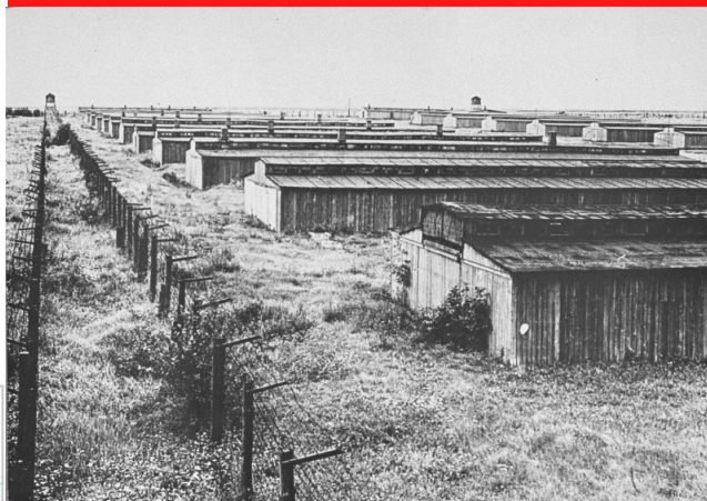
Galpões onde as pessoas eram aprisionadas nos campos.

Com o ideal de raça pura, todos que não eram puros corriam o risco de serem eliminados. Para que restassem apenas os arianos, campos de concentração e extermínio, os campos de concentração agiam como prisões onde eram empregados trabalhos forçados, já os de extermínio, tanto havia trabalho como o extermínio, propriamente dito. Esses campos foram muito bem planejados, eram localizados em lugares de fácil acesso por trens para transportar as pessoas, neles quem criticassem o governo, deficientes físicos e mentais, homossexuais, ciganos e judeus eram assassinadas, as mortes poderiam ocorrer com armas de fogo ou nas conhecidas câmaras de gás.