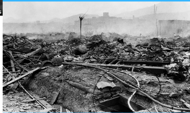
Cidade de Nagasaki, Japão, após os ataques por bomba nuclear.

Com o exército alemão fragilizado, a 8 de maio de 1945, os soviéticos invadem a capital da Alemanha, neste momento que Adolf Hitler comete suicídio. A 2 de setembro o Japão assina o tratado de rendição.