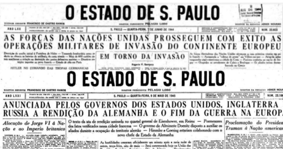
Manchetes do jornal O Estado de São Paulo sobre o fim da Segunda Guerra Mundial