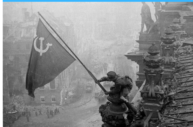
Soldado soviético estende a bandeira da URSS na cidade de Berlim, destruída, após a invasão.