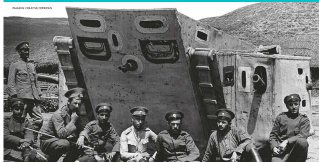
Soldados em frente a um tanque de guerra.

A Mão Negra era uma organização secreta nacionalista que lutava pelo pan-eslavismo, apoiado pela Rússia, e para separar a Bósnia da Áustria-Hungria e incorporá-la à Sérvia.