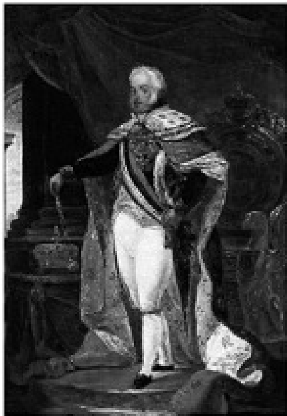
Retrato de D. João VI, Debret, 1817

O Rio de Janeiro passou por uma modernização, seus portos foram melhorados e estradas foram construídas, além disso, a coroa instalou ministérios, tribunais e criou uma Casa da Moeda e o Banco do Brasil, o Teatro Real, a Imprensa Real, a Academia Real Militar, a Academia Real de Belas-Artes e a Biblioteca Real, que constituíram estímulos à produção artística, científica e cultural da colônia.