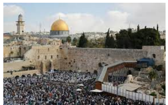
Muro das lamentações, Jerusalém, Estado de Israel

Outro legado dos Hebreus foi o Muro das Lamentações, única parte que restou do templo de Jerusalém construído pelos romanos que se encontra na cidade de Jerusalém e é o local de peregrinação de diversas religiões.