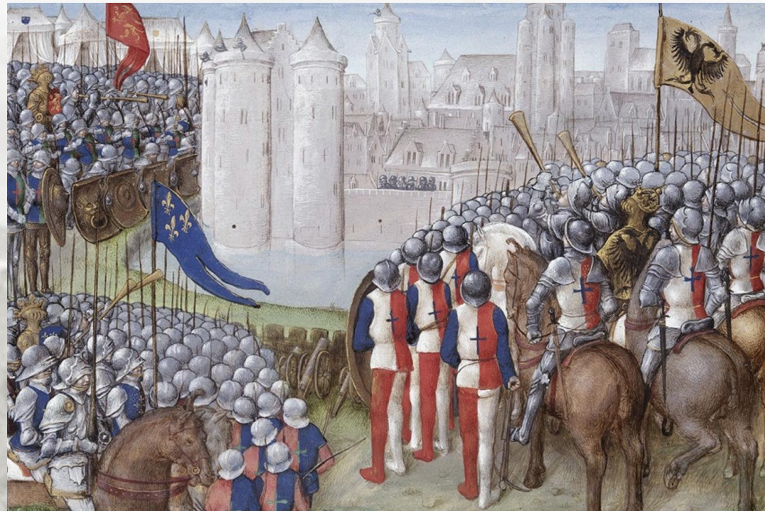
Cerco de Damasco (Segunda Cruzada)