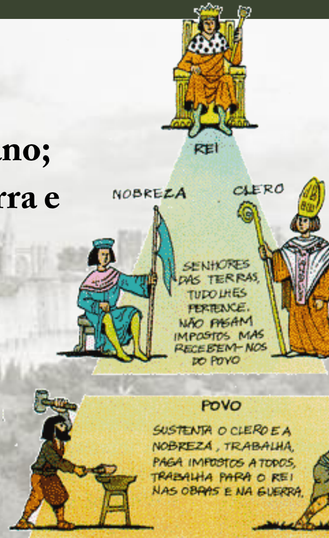
Sociedade de ordens