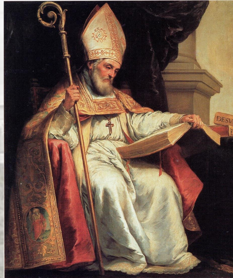
Isidoro de Sevilha