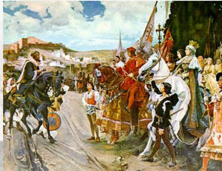
A rendição de Granada