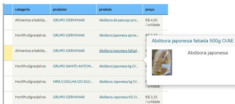
Figura 3: Produto apresentando imagem e descrição.

.Fonte: Elaboração do autor a partir dos dados de campo da plataforma Cirandas.