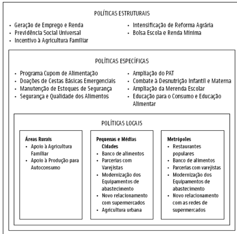
Figura 3 – Esquema das propostas do Projeto Fome Zero.