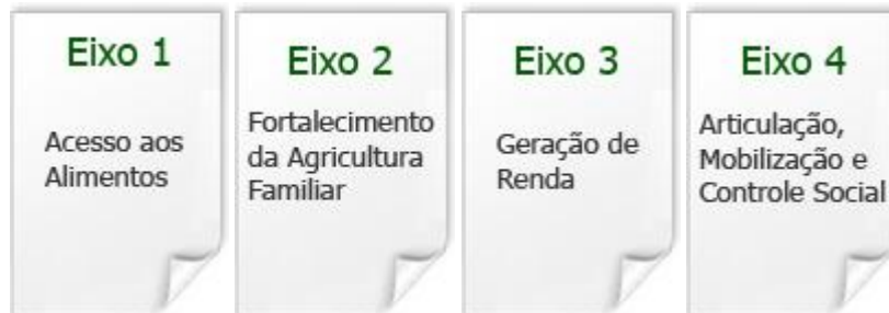
Figura 2 – Eixos articuladores do Programa Fome Zero.