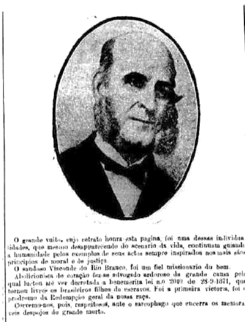
Figura 6 – Visconde do Rio Branco