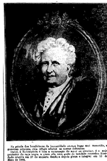
Figura 12 – Princesa Isabel