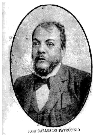
Figura 10 – Patrocínio