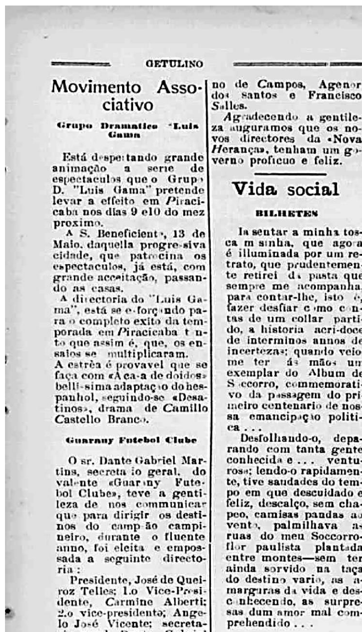
Figura 14 – Registro Movimento Associativo, 1924