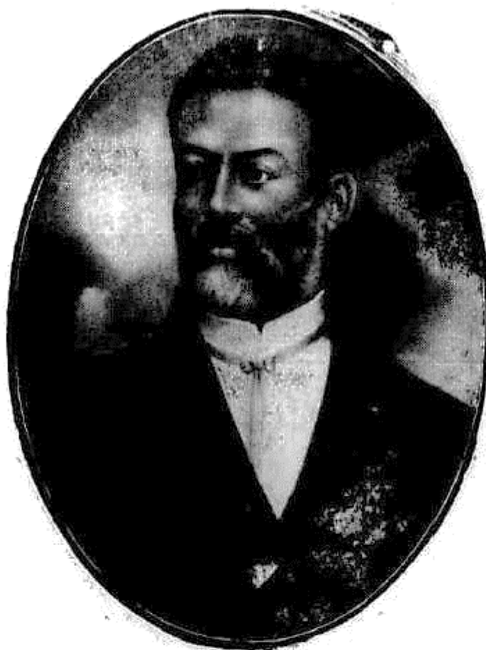
LUIZ GONZAGA PINTO DA GAMA, um dos maiores jornalistas que muito se bateu para livrar sua Pátria da mancha negra da escravidão, tirando as algemas que martirizavam os seus irmãos, resurgendo-lhe o moral e tornando-os úteis à Pátria e à humanidade.