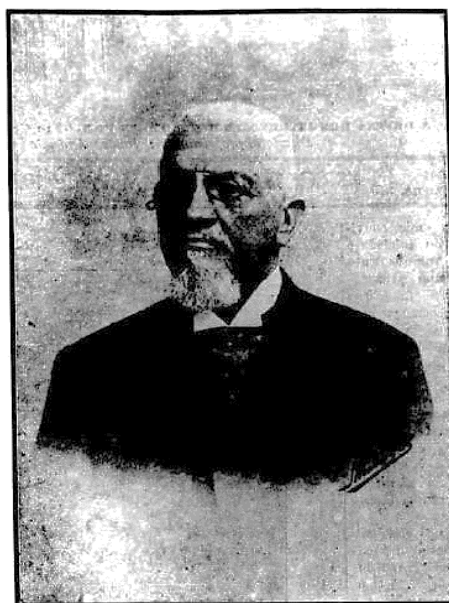
O GENERAL FRANCISCO GLYCERIO, dos ultimos annos