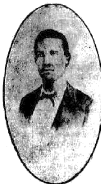
Francisco Glycerio, quando em 1879 iniciou a propaganda da Abolição.