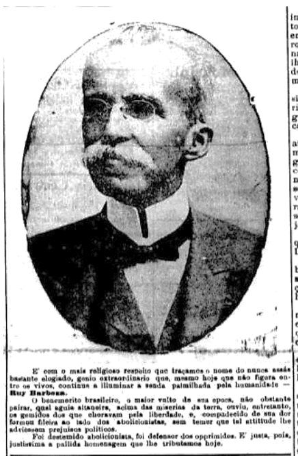
Figura 4 – Ruy Barbosa

homenagem na “galeria dos benfeitores”. Abaixo apresentamos imagens de alguns abolicionistas: