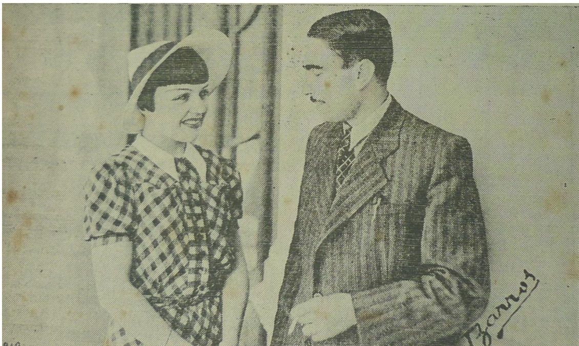
Figura 6. Entrevista realizada por Maximiano com a atriz Maria Costa 1940.

teatro e do cinema de Portugal 308 ". É conveniente acentuar que o período do Estado Novo impulsionou as atividades relacionadas ao cinema no país e neste contexto Pelotas era uma cidade composta por uma elite que se dizia sofisticada e moderna, representada na imprensa, pelo Diário Popular . Por esse motivo a atriz Beatriz Costa, "expressão do teatro e cinema de Portugal", era entrevistada pelo jornal, representado por Maximiano, imigrante de origem portuguesa e componente ativo da comunidade lusa pelotense.