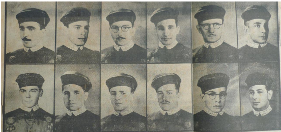
Figura 3. Formandos do ano de 1940 da Faculdade de Direito de Pelotas

O evento possuiu extrema relevância para a elite da sociedade pelotense do período, na ocasião o quadro de formatura fez parte de uma “ exposição, numa mostra da Casa Levy, gentilmente cedida 274 ”. A formatura foi bastante noticiada, inclusive em Portugal, o Correio Português relatou que: