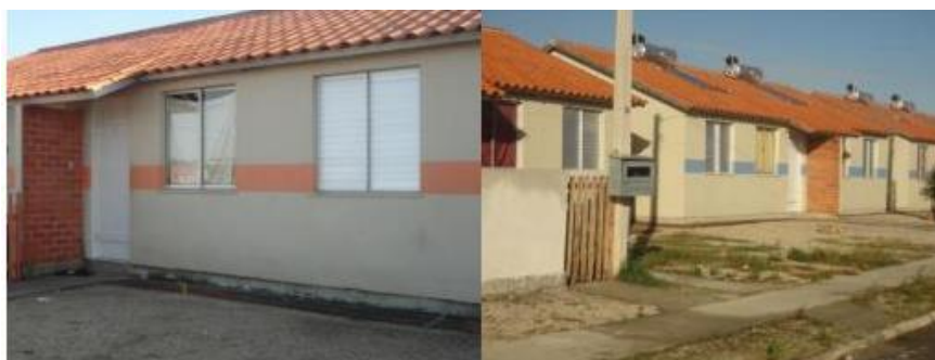
Figura 5 - Casas do Condomínio Residencial Eldorado