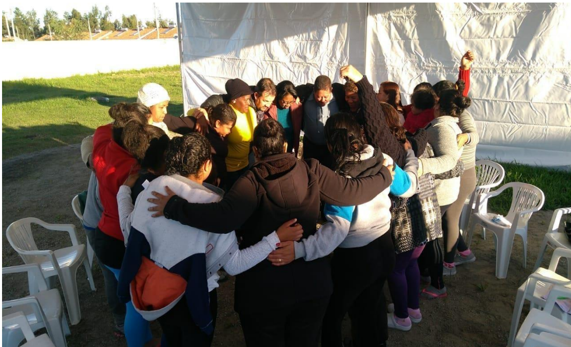
Figura 4 - Círculo de Construção da Paz no Condomínio Residencial Eldorado.