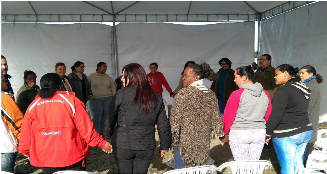
Figura 2 - Círculo de Construção da Paz na Praça da Rua 2 do Condomínio Residencial Eldorado, sob a barraca.