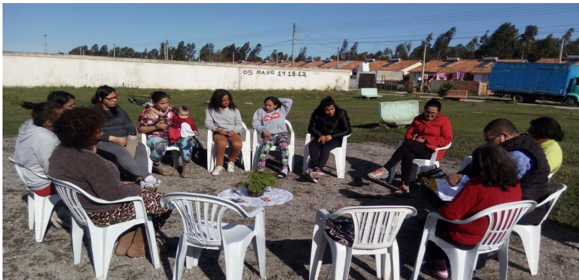
Figura 1 - Círculo de Construção da Paz na Praça da Rua 2 do Condomínio Residencial Eldorado, ao ar livre.