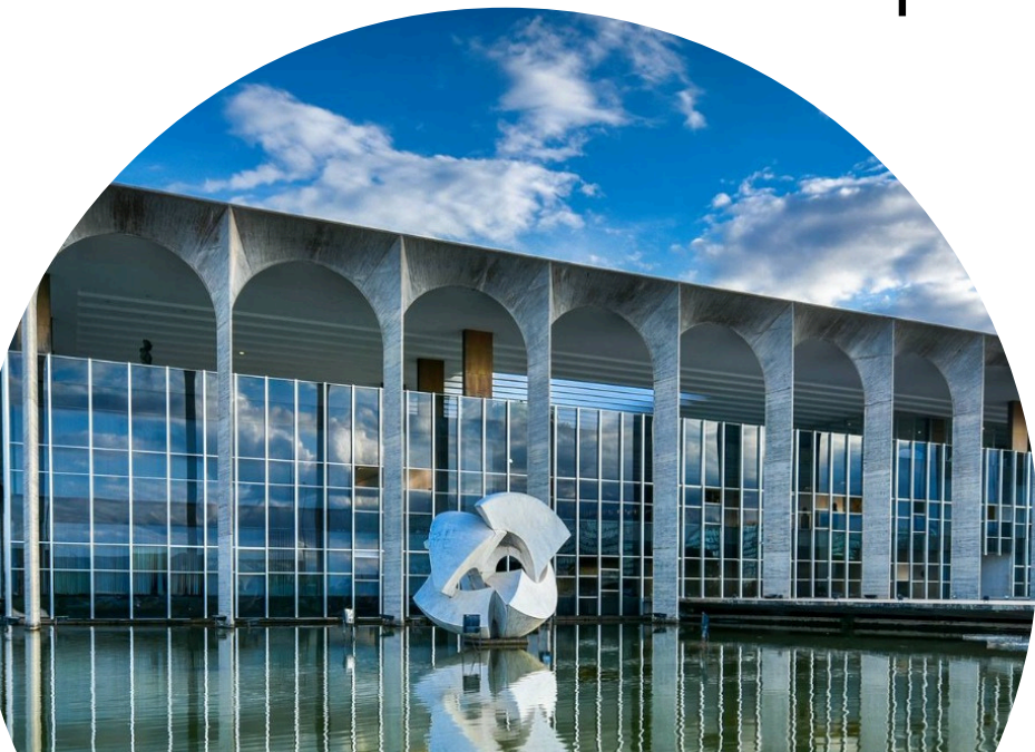
Foto: Palácio Itamaraty, sede do Ministério das Relações Exteriores do Brasil. Esplanada dos Ministérios, Brasília-DF.

✓ Divulgar temas e ações de política externa para o público em geral