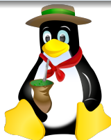
Figura: Exemplo de Figura.

\begin{figure}[!h] \begin{center} \resizebox{100pt}{!} {\includegraphics[width=0.8\linewidth]{./figuras/Caneca-tux.pr \caption{Exemplo de Figura.} \label{fig1} \end{center} \end{figure}