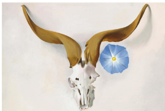
Cabeça de Carneiro, Corriola azul. 1938. Técnica: Oleo sobre tela Dimensões da obra: 20 x 30 polegadas Museu Georgia O'Keeffe

Sua carreira se desenvolveu totalmente dentro dos Estados Unidos, tendo saído do país apenas depois de seis décadas pintando em solo americano. Em 1951 ela viaja para visitar Frida Kahlo no México, as duas se conheceram anteriormente e já haviam trocado correspondências, e em 1971 O'Keeffe viaja o mundo, as imagens das nuvens vista do avião cativam a pintora que passa a pintar as nuvens, uma dessas pinturas tem mais de dois metros e meio por sete.