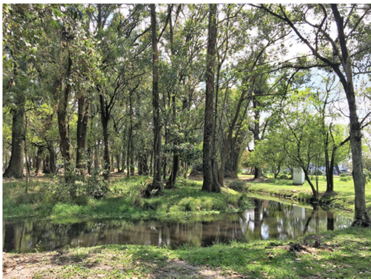
Figura 04 – Lago com configuração de ilha localizado no bosque do parque.

Essas análises evidenciam o ideal de beleza paisagística do século XIX, que harmonizava cenários brutos com cenários leves, a ordem rígida da forma com o cuidadoso projeto para representar a aleatoriedade. Nesse período, o paisagismo buscava um equilíbrio entre o jardim barroco francês e o jardim cenográfico no estilo romântico inglês. Como reforçam Moore, Mitchel e Turnbull (2011, p.59): “O belo contrasta com o sublime, caracterizado pelas coisas brutas, enrugadas, selvagens [...]”. A criação formal desses jardins estava relacionada à busca da harmonia e do conceito de beleza, mas também representava a essência social e econômica da família Antunes Maciel