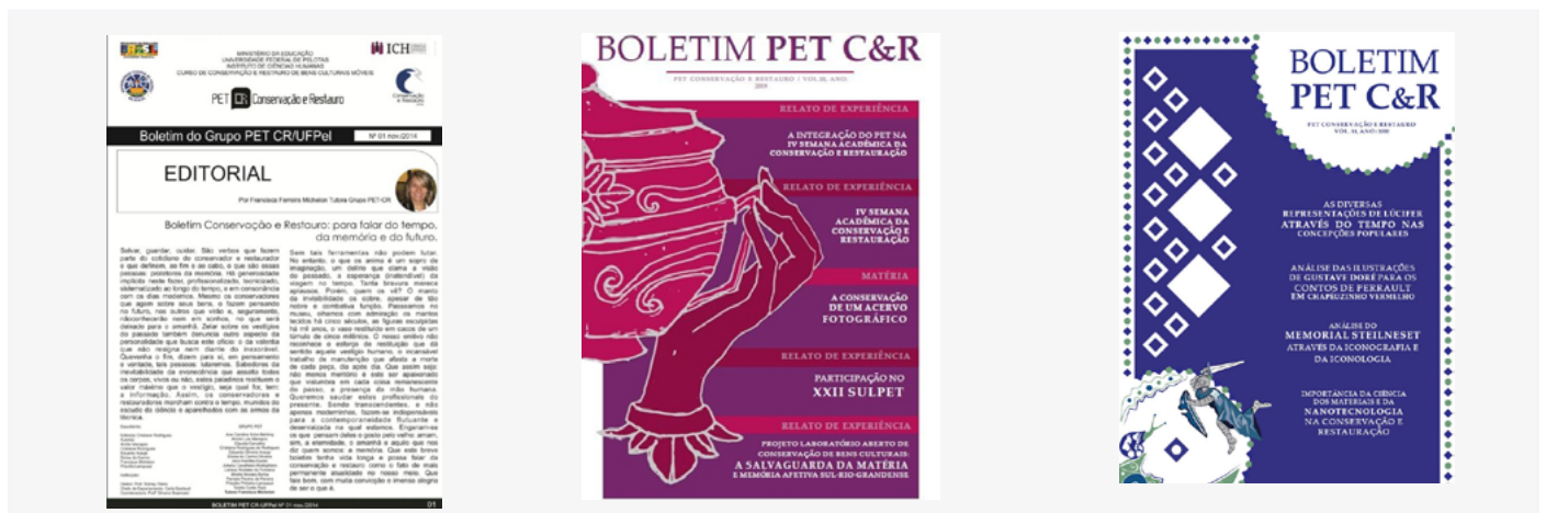
Capas do Boletim- Fonte: PET CR

Algumas atividades são realizadas desde os primeiros anos do grupo PET-CR, como o Boletim do PET-CR e o CinePET-CR. O Boletim do PET-CR consiste na organização e edição de um boletim informativo lançado semestralmente. O trabalho para a construção do boletim integra os petianos funcionando como diretriz para construções didáticas. Ao desenvolver o Boletim os alunos estão atrás de informações sobre a profissão, discutem a pertinência de determinados assuntos e desenvolvem a comunicação escrita. Em 2020 o grupo PET-CR decidiu ampliar a captação de material para além dos integrantes do grupo. Na chamada para o Boletim 12, com tema artístico 'Monumentos' e conteúdo de tema livre, estava aberto o convite. Entre os elementos aceitos nesse novo formato, estão resumo expandido, desenho, música, poema ou fotografia.