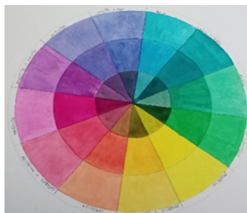
Figura 1: Disco das cores

Após conhecer as técnicas e as possibilidades de tonalidades de cada cor, foram realizados exercícios com utilização de ilustrações (figuras 3), onde colocamos em prática todo o aprendizado dos exercícios anteriores.