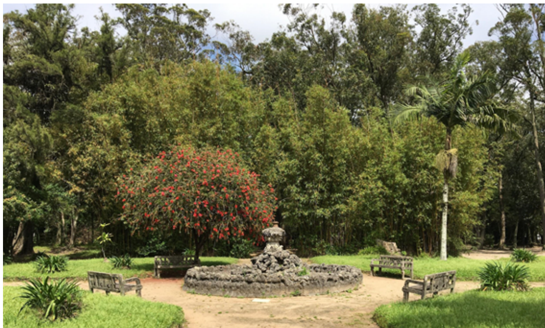
Figura 03 – Chafariz centralizado na configuração demarcada pelos canteiros.