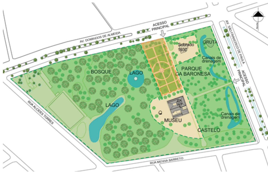
Figura 02 – Planta baixa da localização dos jardins da Chácara da Baronesa. Na demarcação laranja é identificada a área verde de inspiração barroco francesa. Na indicação verde é observado o jardim com referência no romantismo inglês.