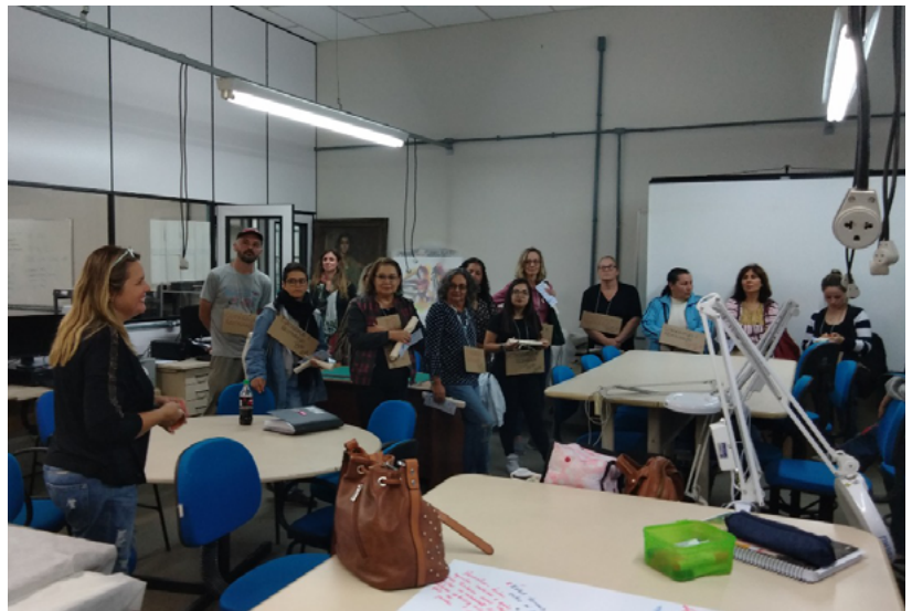
Recepção de Calouros em 2018

Anualmente, os grupos PET precisam organizar-se através de um planejamento de atividades para o ano seguinte e produzir um relatório das atividades que foram desenvolvidas ao longo do ano, além de prestar contas sobre como os recursos de custeio foram investidos.