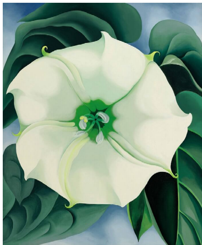
Jimson Weed/White Flower No. 1. 1932. Técnica: Oleo sobre tela Dimensões da obra: 121.9 x 101.6 cm https://www.georgiaokeeffe.net/jimson-weed-white-flower.jsp