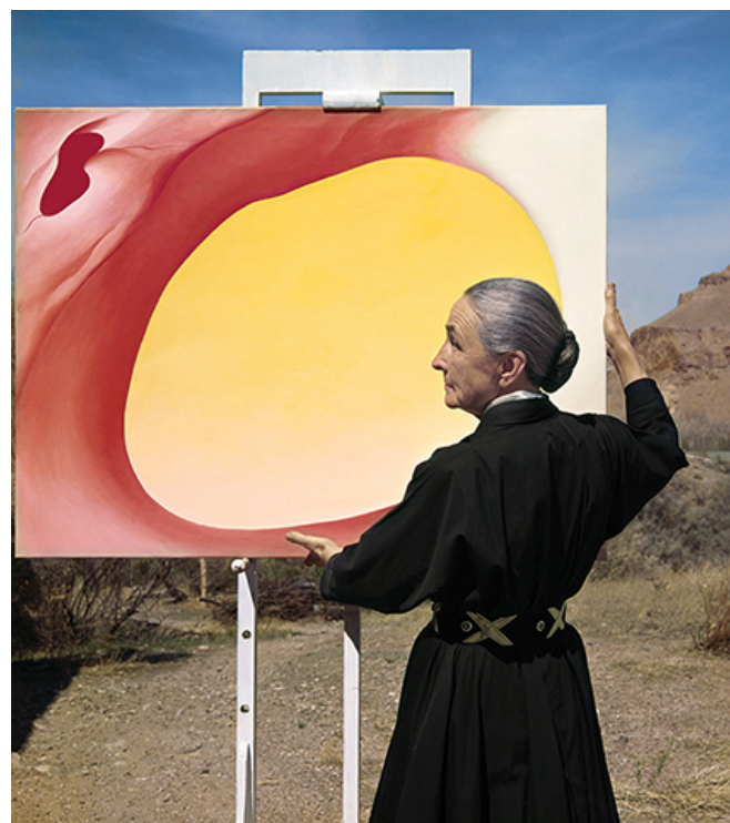
O'Keeffe com sua obra "série Pélvis, Vermelho com Amarelo".