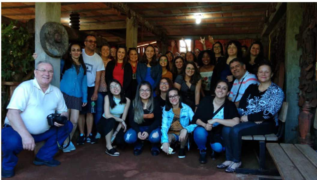
Visita ao Ponyo e Memória Missioneira, em São Miguel das Missões

Em 2018 o grupo PET CR iniciou a organização do seu primeiro E-book da Conservação e Restauração, tendo como objetivo compilar trabalhos de conclusão de curso (TCC), realizados ao longo dos dez primeiros anos de desenvolvimento da Conservação e Restauração na UFPel. Em abril de 2020 a primeira edição, Conservação e Restauração: Ciência e prática na formação profissional, foi lançada e está disponível no repositório institucional da UFPel!