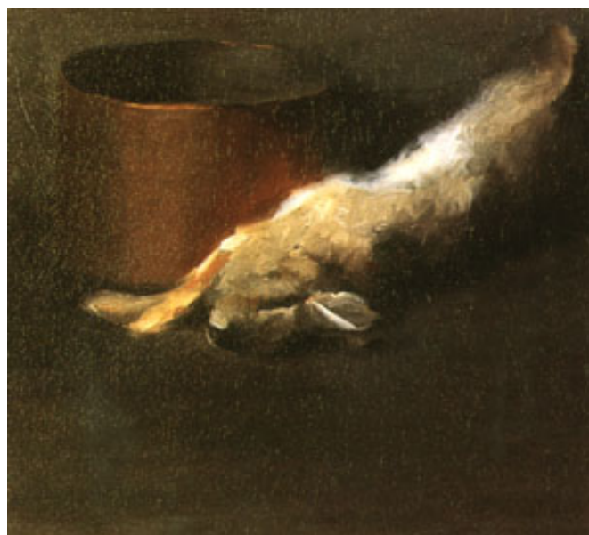
Coelho morto e panela de cobre de O’Keeffe, 1908.

Ela passa a experimentar a abstração e produz então uma série de imagens, feitas em carvão, um trabalho completamente diferente das pinturas figurativas que fazia, entre elas “desenho XIII”, que é exibidas pela primeira vez em Nova York, na galeria 291, galeria do fotógrafo Alfred Stieglitz (1864-1946) que futuramente tornaria se seu marido. Em 1918 toma a decisão de mudar de vez para Nova York e dedicar-se exclusivamente a arte.