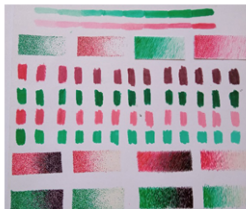
Figura 2: Exercícios cromáticos