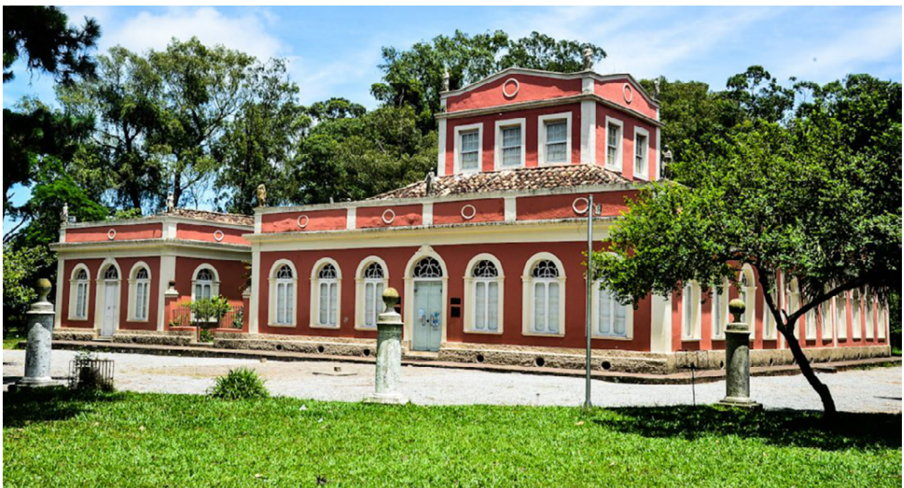
Figura 01 – Museu Municipal Parque da Baronesa.

Pelotas, instituída freguesia em 1812, atingiu o status de cidade em 1835, e entre os anos de 1870 e 1931 passou por transformações na sua área central, de forma a melhorar a qualidade de vida dos habitantes. Segundo Santos (2007), dentre as mudanças pode-se citar a implantação de canalizações de água e iluminação pública e privada a gás, arborização de praças, rede de esgotos, iluminação elétrica e pavimentação de ruas e avenidas com paralelepípedos em granito. Também nesta época, conforme Rosenthal e Santos (2013), o ecletismo historicista na arquitetura edificada se desenvolvia na cidade, e as construções passaram a apresentar vazios centrais ou laterais em relação ao limite do lote. Estes espaços, ainda segundo os autores, tornaram-se áreas verdes privadas, proporcionando além de uma melhor aeração dos ambientes internos, um requinte aos palacetes historicistas.