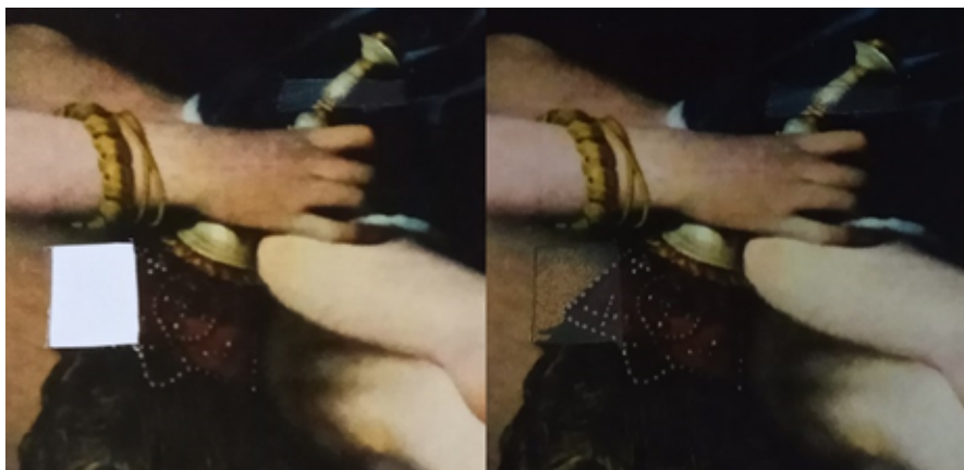
Figuras 3: Exercícios com utilização de ilustração utilizando a técnica de pontilhismo

O resultado de cada exercício foi bastante satisfatório em relação ao que foi proposto, em muitos momentos ficou claro como é importante desenvolver as atividades presencialmente em laboratório. Os encontros virtuais através da plataforma WEBConf ajudaram a sanar dúvidas, mas de alguma forma ainda não foram suficientes para se obter melhores resultados, pois nada se iguala a didática presencial do professor.