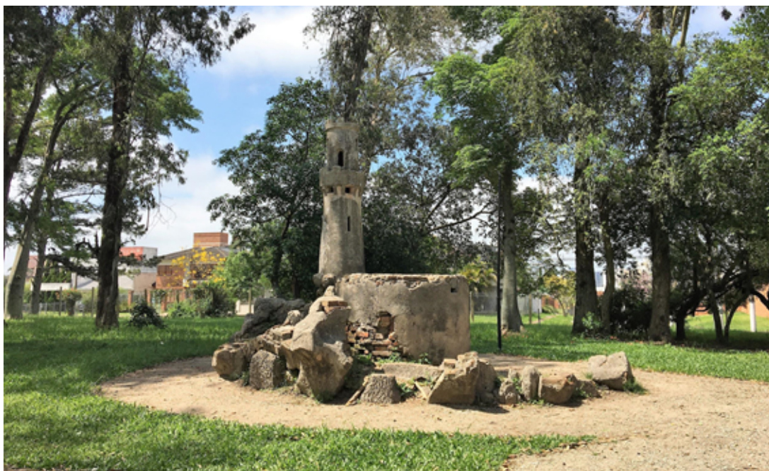
Figura 07 – Pequeno castelo com a função de viveiro para coelhos.

O espaço natural, presente na Chácara da Baronesa, é um importante monumento, visto que traduz historicamente formas materiais e imateriais de representação do século XIX. É possível identificar processos inéditos de melhorias construtivas, mas também há a leitura da mentalidade social presente no status da família e como esta expressava seu estilo através das referências europeias. Porém, a palavra monumento, sozinha, é uma classificação dura e estática para a característica mutável dos jardins que, além de carregarem uma memória, são transformados pela ação do homem e do tempo e reconhecidos atualmente como patrimônio histórico brasileiro. Assim, através dessa análise, percebe-se os jardins do Parque da Baronesa como a representação completa de um monumento vivo para a cidade de Pelotas.