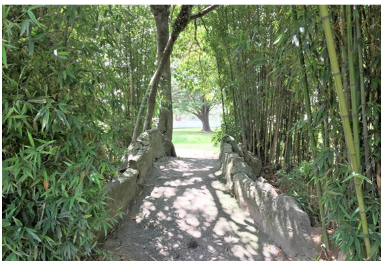
Figura 05 – Ponte com a técnica rocaille identificada no guarda-corpo.