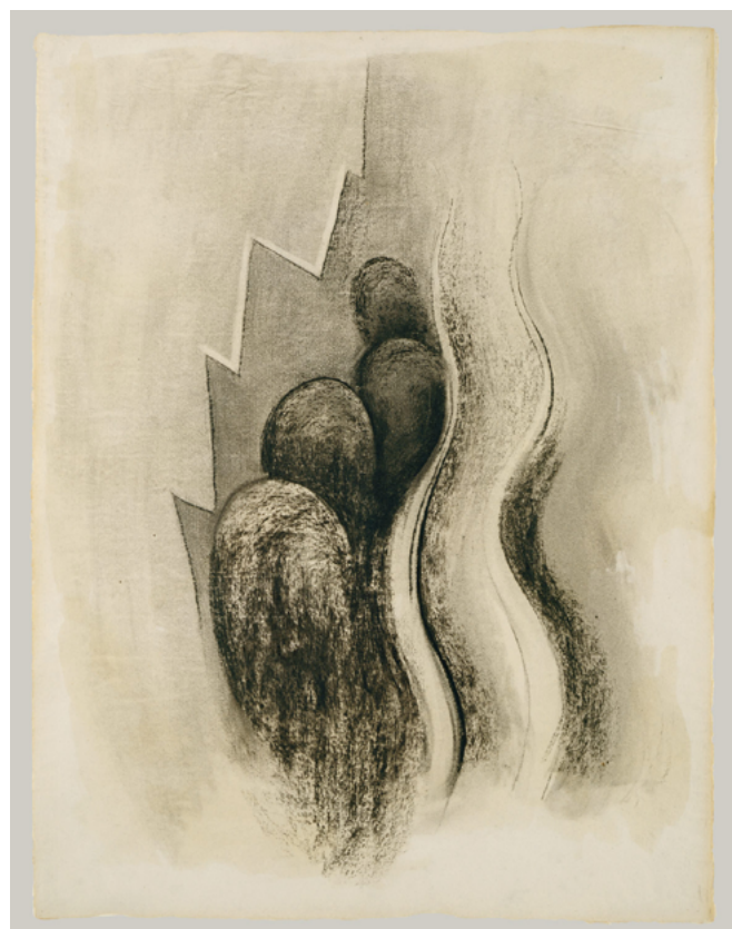
Desenho XIII. 1915.