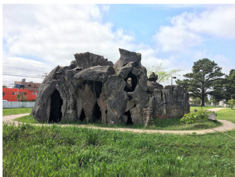
Figura 06 – Gruta construída com a técnica rocaille . Fonte: autoria própria. Fonte: autoria própria.