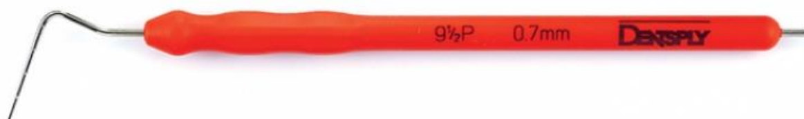
Figura 5. Condensador Apical Schilder para dentes posteriores (“Schilder Plugger [Heat Carrier] Posterior Sterile N°9.5P 0.7 mm”, Dentsply Maillefer).