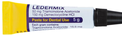
Figura 2 – Pasta dental corticoide/antibiótica (tetraciclina) Ledermix (Haupt Pharma GmbH, Wolfratshausen, Germany). Composição: “Demeclocycline calcium equivalent to Demeclocycline hydrochloride (30 mg/g) + Triamcinolone acetonide (10 mg/g)” (ABBOTT, 2016; HPRÁ, 2019).

Segundo Trope (2010), os antibióticos tópicos para o controle da infecção endodôntica vem sendo estudados e utilizados clinicamente. Três antibióticos destacam-se na literatura pela sua efetividade antimicrobiana no canal radicular e capacidade de prover condições para o reparo apical: ciprofloxacina, metronidazol e minociclina. O preparo da medicação intracanal com quantidades iguais dos três antibióticos citados em um veículo (solução fisiológica ou glicerina) e em consistência de dentífrico é denominado de Pasta Triantibiótica. Algumas variações da pasta original têm sido usadas, resultando em sucesso. Dentre elas cabe citar a remoção da minociclina, que causa a coloração do tecido dentinário ou também pode ser feita a substituição dela pelo Cefaclor (TROPE, 2010, p. 314, 320). Cabe salientar que os antibióticos citados não contêm anel beta-lactâmico (TEIXEIRA, 2013, p. 35).