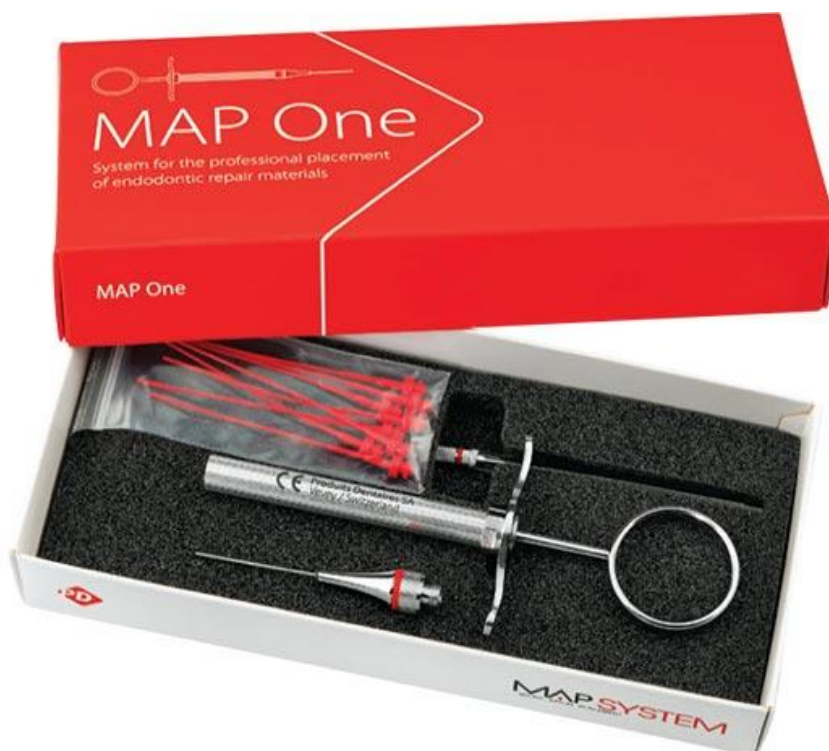
Figura 4. “MAP System (Micro Apical Placement System, Dentsply Maillefer)”.

“Messing gun” ou “Messing root canal gun” é um aplicador de amálgama modificado desenvolvido por J. J. Messing (Endodontista Inglês), usado para colocar materiais como o MTA e o Sulfato de Cálcio na porção final do canal radicular ou em perfurações radiculares em procedimentos de obturação retrógrada, apicificação com MTA ou tratamentos de perfurações radiculares. < https://www.oxfordreference.com/view/10.1093/oi/authority.20110803100152576 >.