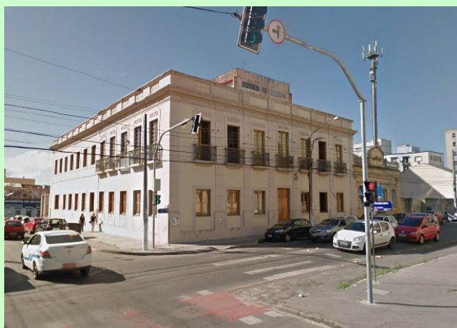
↑Campus SALIS GOULART – UFPeI Félix da Cunha 520 (Entrada pela Tiradentes – Mapa )