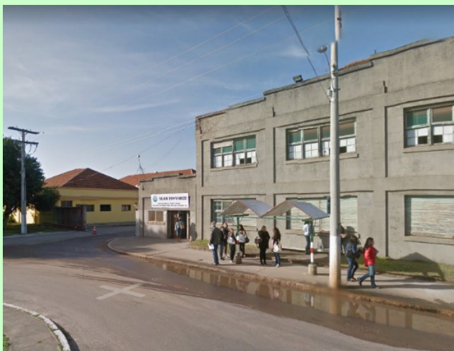
↑CAMPUS ANGLO UFPEL Rua Gomes Carneiro nº 1 ( Mapa ) ATENÇÃO: COMO DE PRAXE, NÃO SERÁ PERMITIDA A ENTRADA DE VEÍCULOS NO PÁTIO DO CAMPUS.