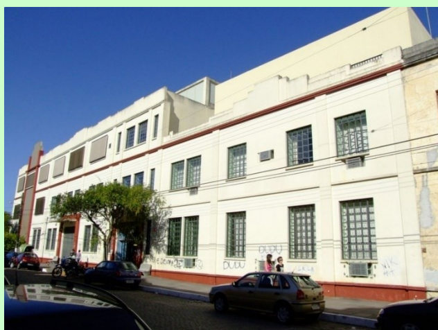
↑CAMPUS DAS CIÊNCIAS SOCIAIS UFPeI- CCS Rua Alberto Rosa nº 154 ( Mapa )