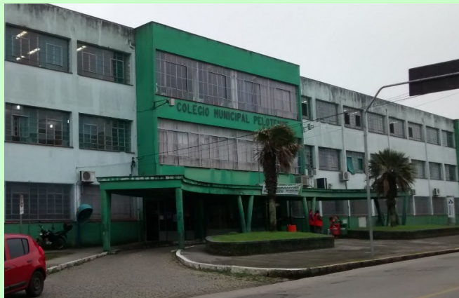
↑COLÉGIO MUNICIPAL PELOTENSE END: Marcílio Dias nº 1597 ( Mapa )