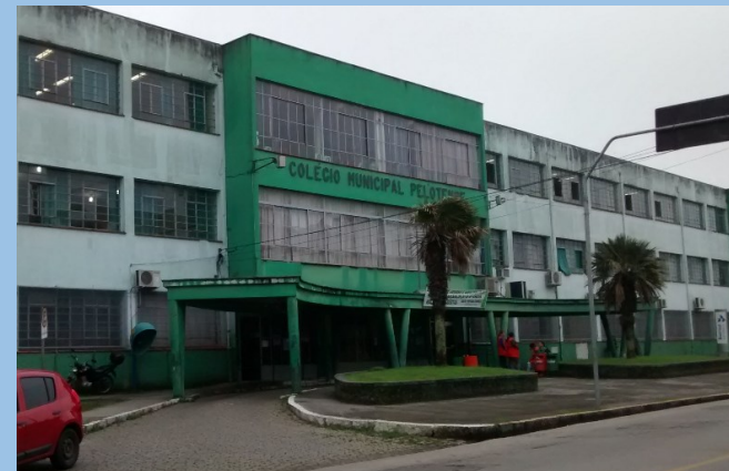
↑COLÉGIO MUNICIPAL PELOTENSE END: Marcílio Dias nº 1597 ( Mapa )