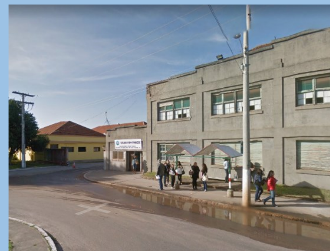
↑CAMPUS ANGLO UFPeI Rua Gomes Carneiro nº 1 ( Mapa ) ATENÇÃO: COMO DE PRAXE, NÃO SERÁ PERMITIDA A ENTRADA DE VEÍCULOS NO PÁTIO DO CAMPUS.