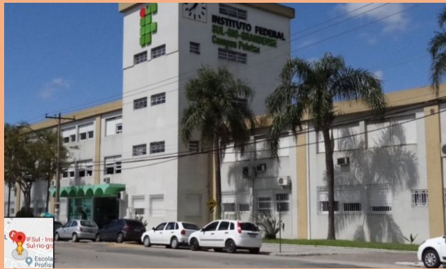
↑IFSUL Praça 20 de Setembro nº 455 ( Mapa )