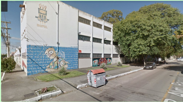
↑PRÉDIO 6 –UFPEL CAMPUS BARROSO CCHS (Rua Almirante Barroso 1202– Mapa )