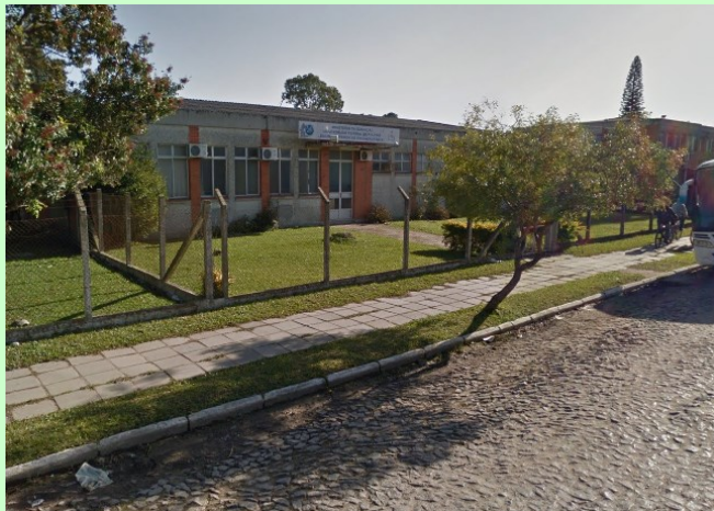
↑ESEF ESCOLA SUPERIOR DE EDUCAÇÃO FÍSICA –UFPEL (Rua Luís de Camões 625– Mapa )