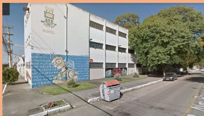
↑PRÉDIO 6 –UFPEI CAMPUS BARROSO CCHS (Rua Almirante Barroso 1202– Mapa )