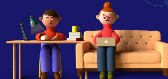
Figura 11: pesquisa com uso de filtro