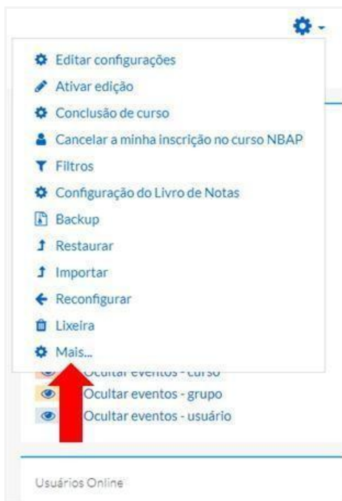
Figura 1: acesso ao menu de opções

No Menu Administração > Administração do curso > Relatórios podemos acessar os relatórios das atividades realizadas por cada estudante, inclusive com os horários de acesso e tempo de permanência no ambiente. Observe as Figuras 1 e 2 a seguir: