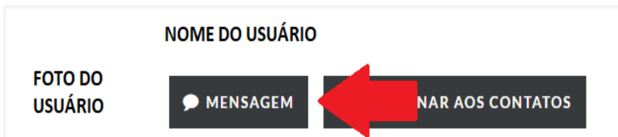
Figura 17: enviando a mensagem