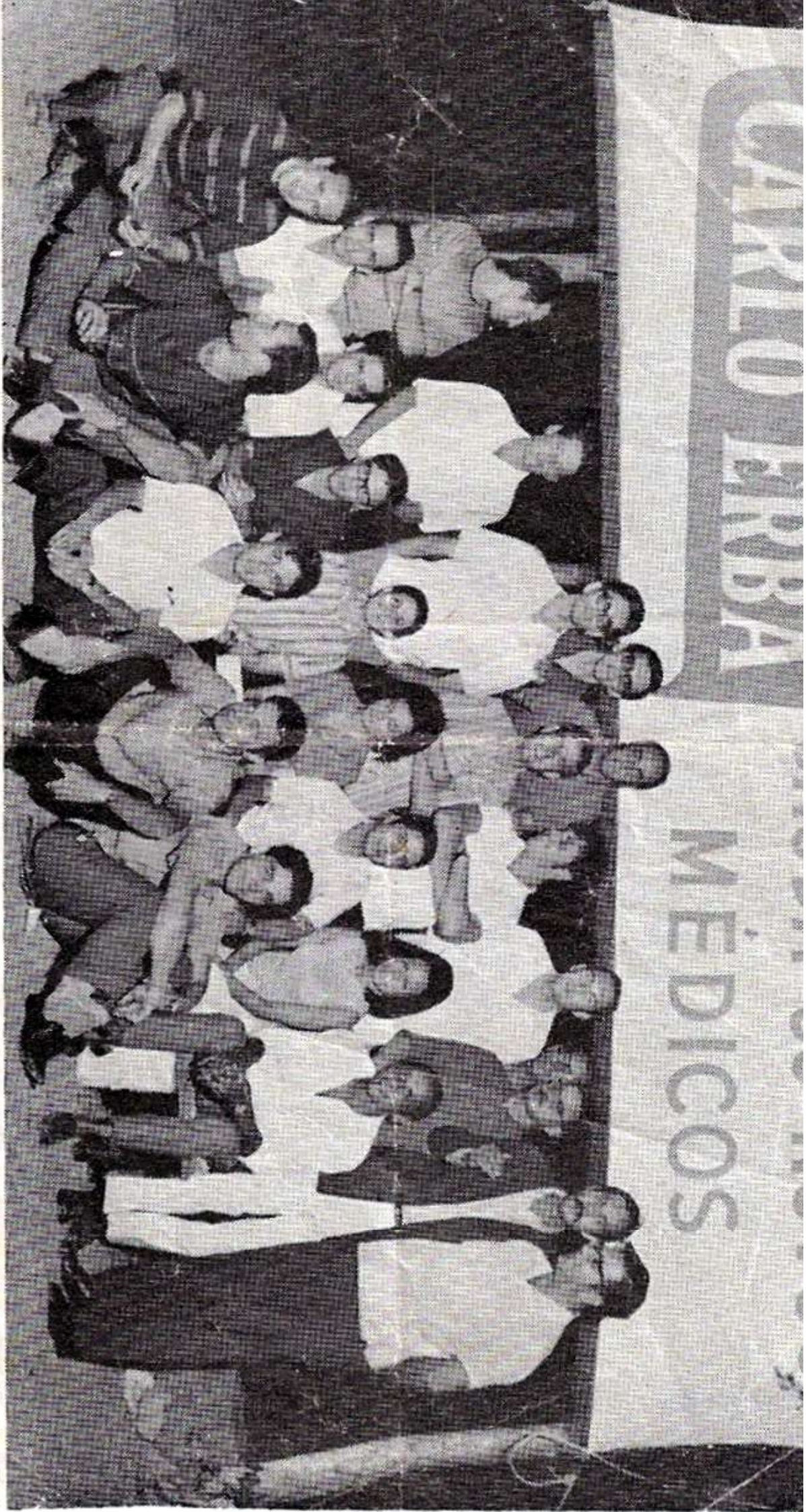
pelotas. — A turma dos doutorandos do Instituto Pró Ensino Superior do Sul do Estado de Rio Grande do Sul