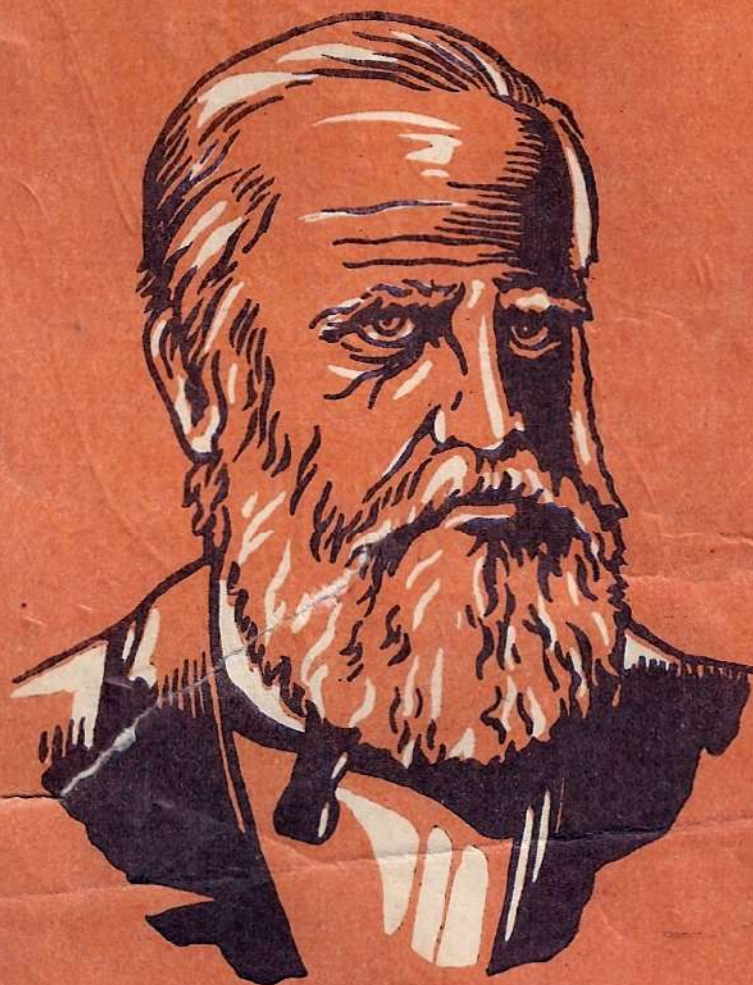
D. PEDRO II