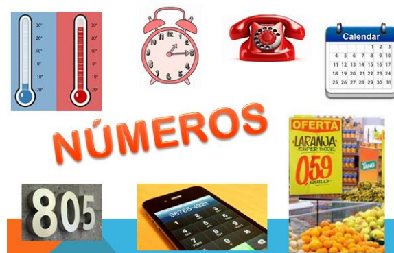
Figura 3: Números no nosso dia a dia.

A professora ia liberando os microfones, de forma organizada, para que todos pudessem compartilhar suas respostas. Entre as respostas das crianças, apareceu: idade, tamanho da roupa e do calçado, número do telefone, calendário, pontos de referência da cidade, supermercado, códigos, entre outros. Na sequência, foi mostrada a Figura 3.