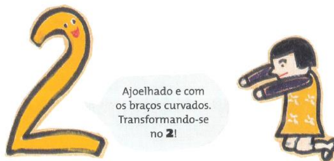
Figura 2: Representando o número 2.

A segunda parte da oficina foi pensada para mostrar que além das mãos podemos usar todo o nosso corpo para representar os números. Essa atividade foi adaptada do livro O mundo mágico dos números , da Coleção Tan Tan e a Figura 2 foi extraída do livro.