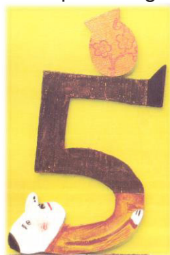
Figura 4: Representando o número 5.

O fechamento da oficina foi feito a partir da solicitação de um registro deste momento, no qual cada criança deverá escolher um número entre 0 e 99, que seja significativo para ela, e fazer um desenho do seu corpo representando este número, como pode ser visto no exemplo da Figura 4.