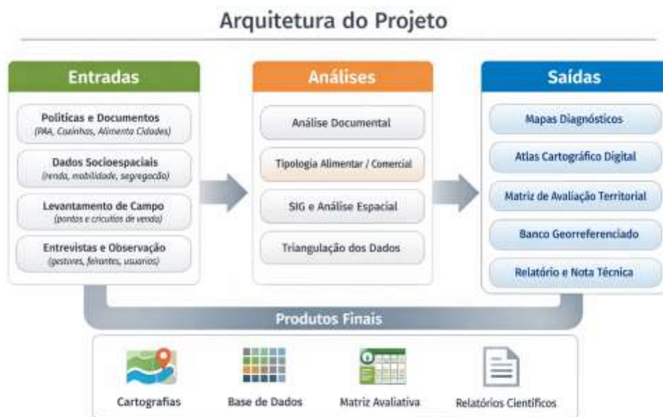
Figura 1 - Arquitetura do projeto e instrumento de avaliação territorial

Palavras-chave: Paisagens alimentares; Políticas públicas; Sistemas de abastecimento; Fome; Desigualdades socioespaciais.