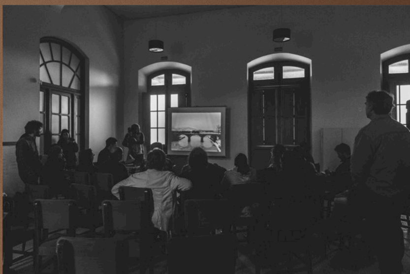
Estação Férrea de Pelotas, 22 de junho de 2015. Primeira restituição parcial da pesquisa e debate sobre o Memorial da Estação Férrea.