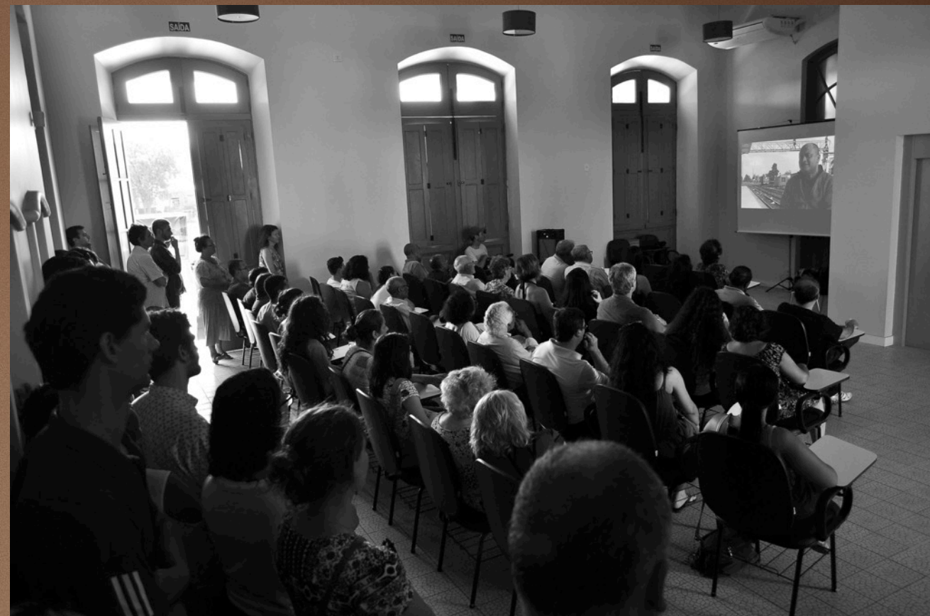
Estação Férrea de Pelotas, 12 de dezembro de 2015. Restituição da pesquisa através do vídeo documentário Vida nos Trilhos.