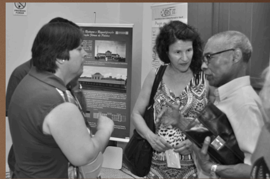
Estação Férrea de Pelotas, 12 de dezembro de 2015. Restituição da pesquisa através do Museu de Rua "Vida nos Trilhos".