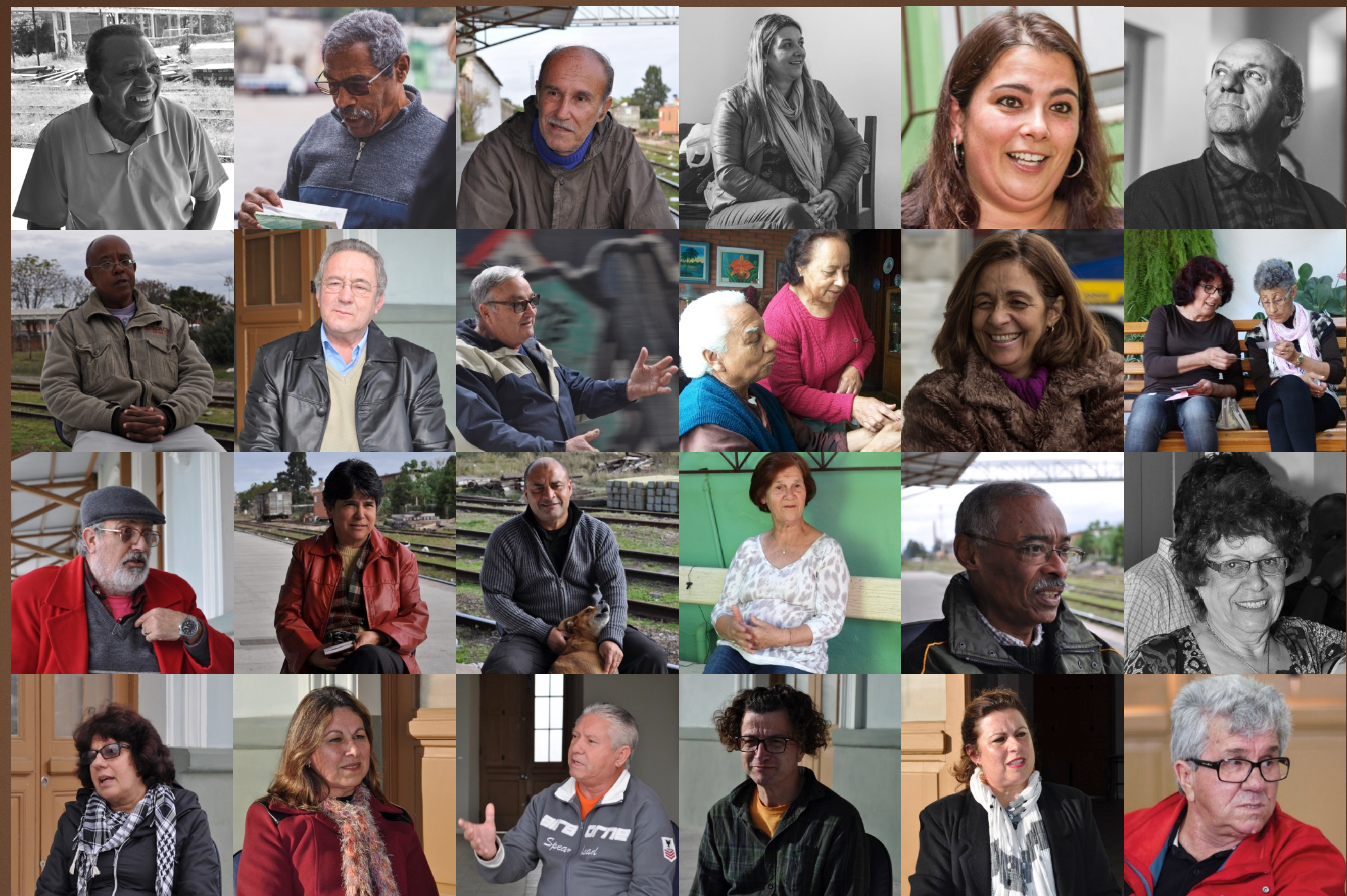
Interlocutores da pesquisa