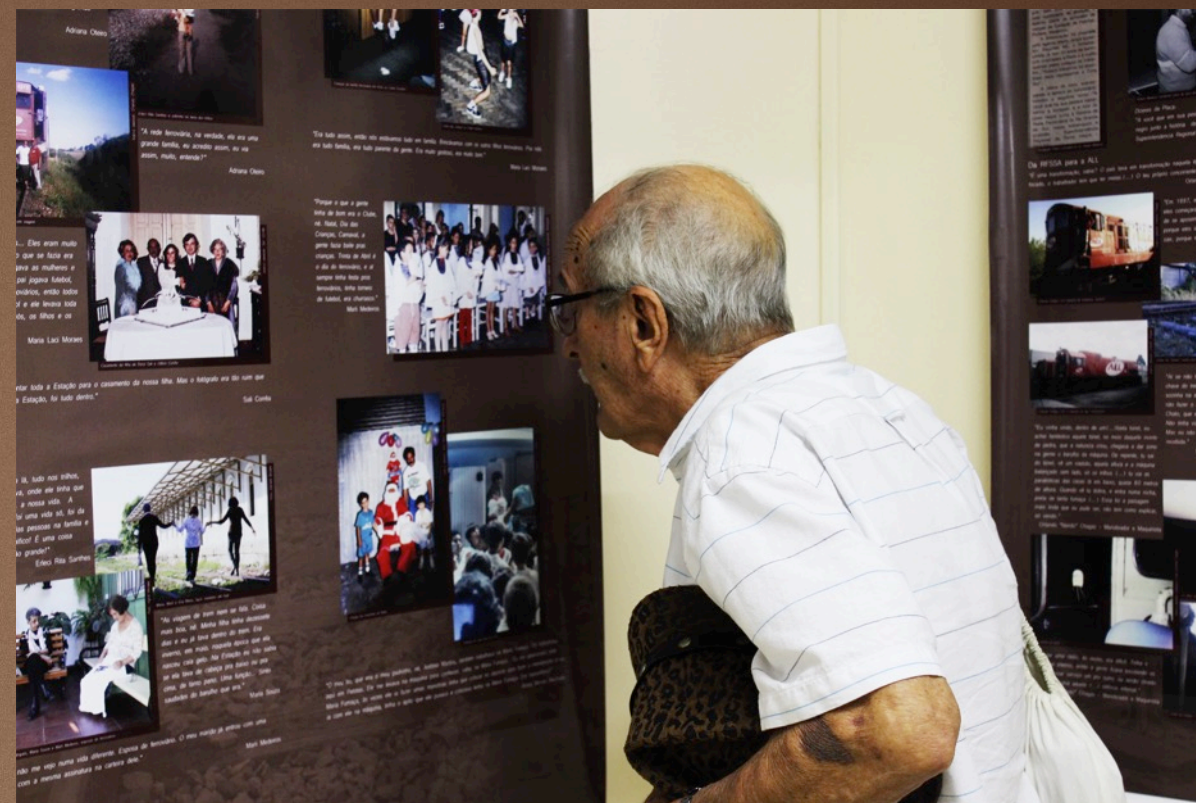
Restituição dos produtos de pesquisa: Museu de Rua e vídeo documentário “Vida nos Trilhos” no Sindicato dos Trabalhadores em Empresas Ferroviárias do Estado do Rio Grande do Sul (SINDIFERGS) em Porto Alegre, de 08 de abril a 21 de outubro de 2016.