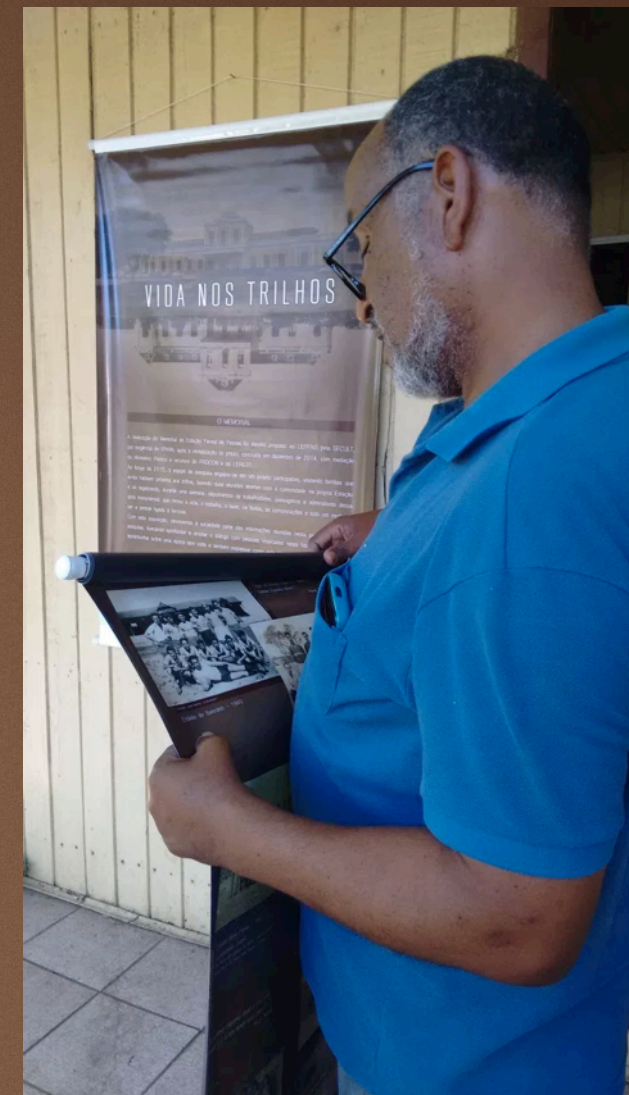
Museu de Rua “Vida nos Trilhos” exposto na Delegacia Sindical Ferroviária de Pelotas (largo da Praça Rio Branco/ Estação Férrea, Nº 58) em novembro de 2016.