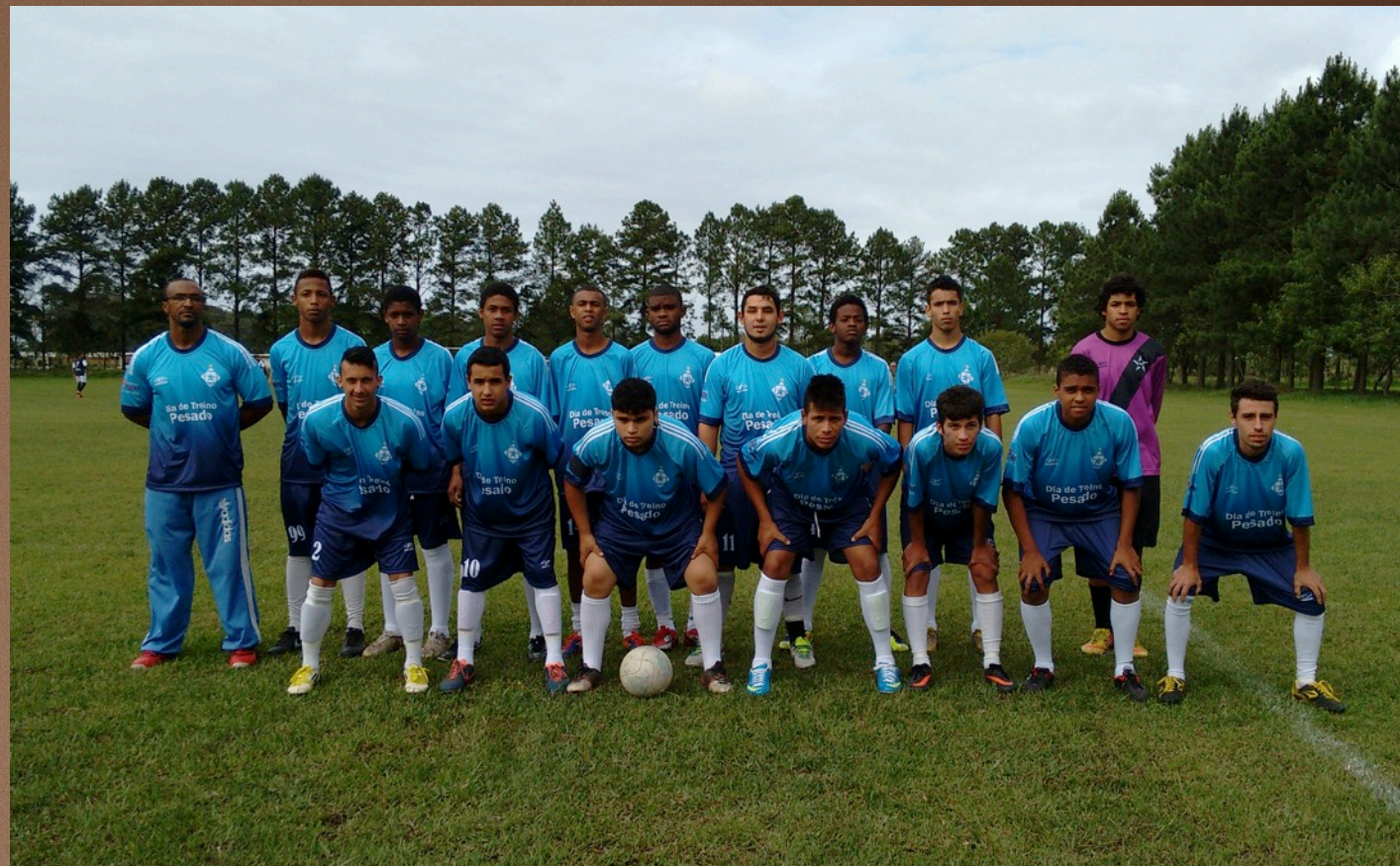
Força Jovem Simões