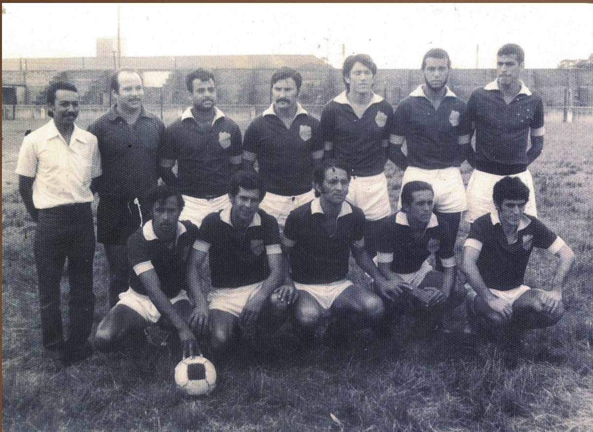
Terror do Bairro