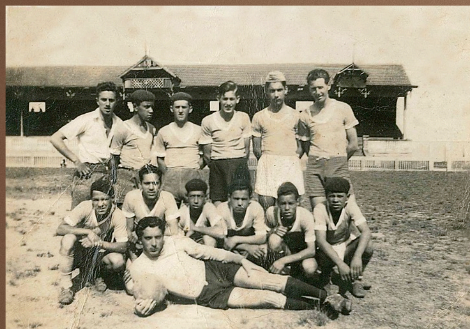
Estádio do Bancário