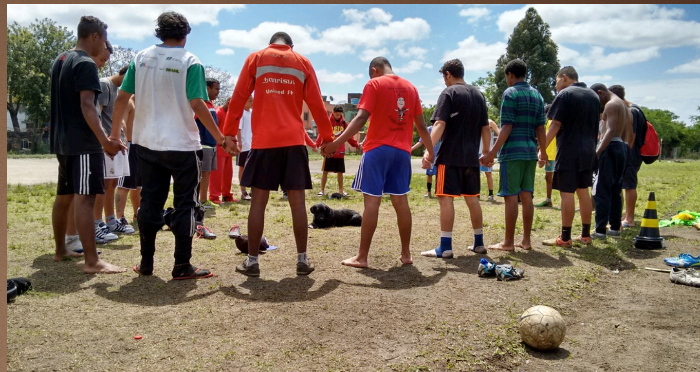
Força Jovem Simões

O Projeto, desde que entrou na minha vida e na vida de quem participa, realmente mudou a gente.