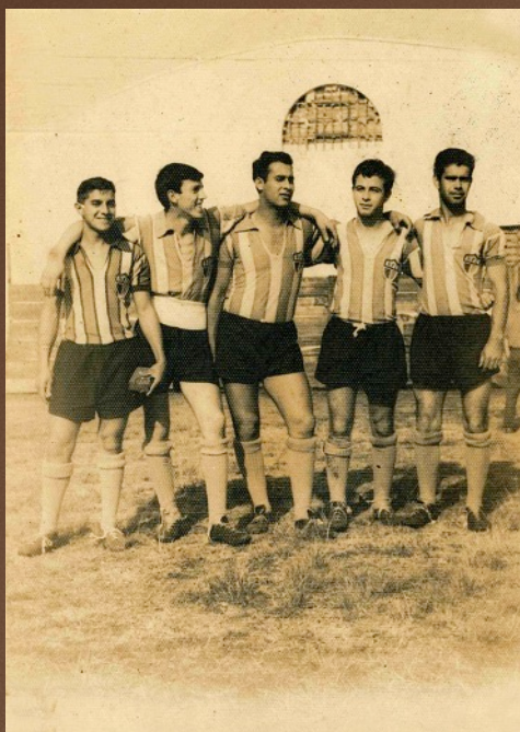
Terror do Bairro