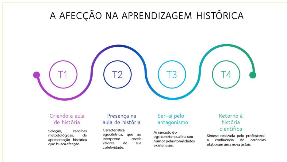
Figura 1 – A Afecção na aprendizagem histórica