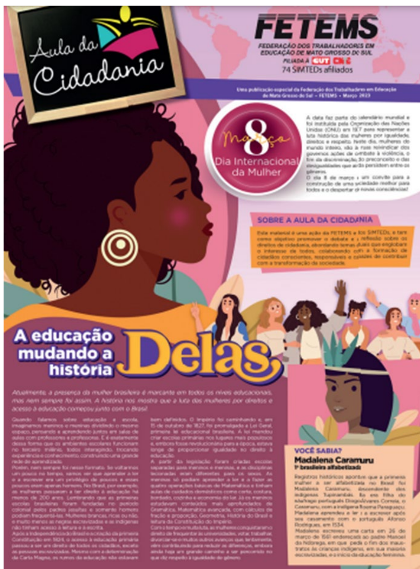
Figura 1: Capa do jornal

contra elas e apresenta também algumas sugestões de atividades a serem desenvolvidas em sala de aula.