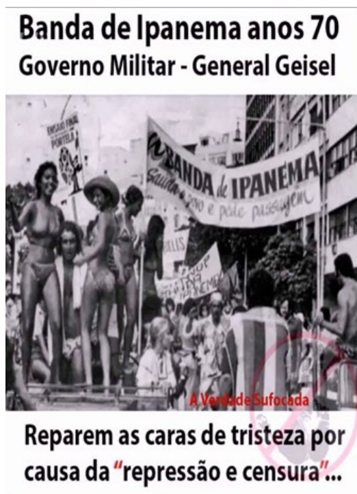
Figura 3 - Banda de Ipanema anos 70