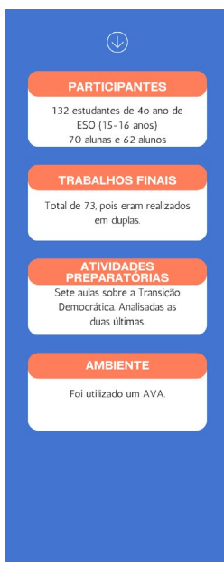
Figura 1 – Desenvolvimento da metodologia de pesquisa de Miguel e Sánchez (2017), adaptado pelas autoras.