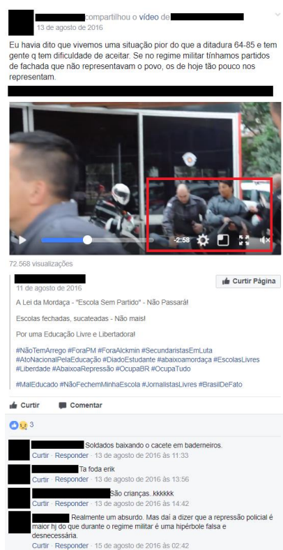
Figura 1 - Cena de repressão policial registrada por um internauta 2