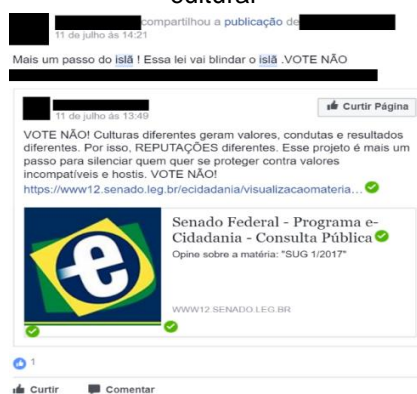
Figura 4 - Consulta pública feita pelo Senado Feral sobre a proposta que visa tornar inafiançáveis crimes de discriminação ou preconceito de procedência regional ou identidade cultural 9