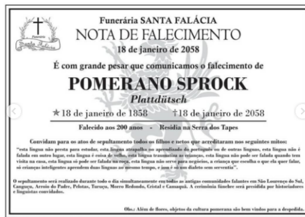
Figura 1 – Postagem no Instagram baseada no texto “Uma língua também pode morrer”