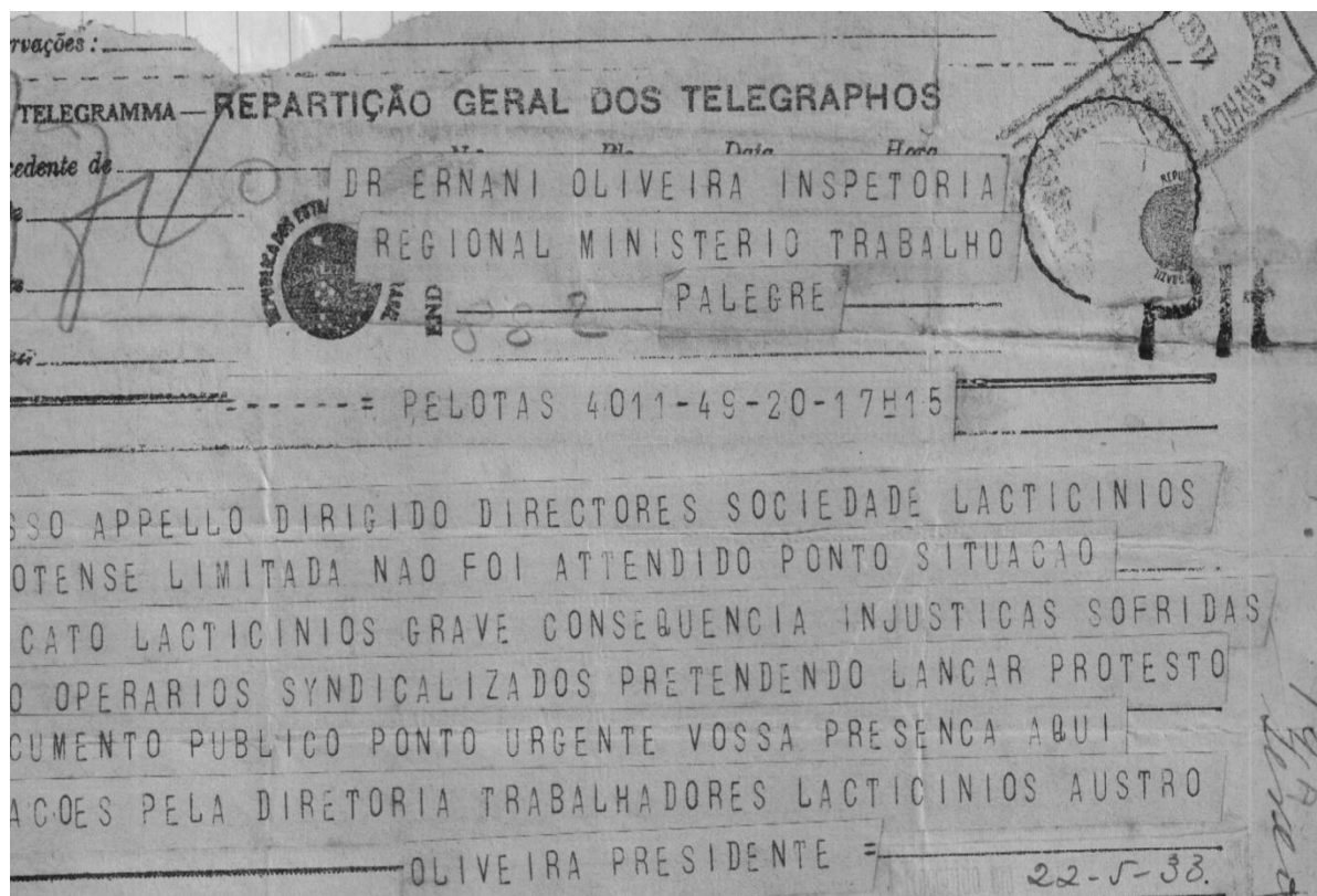
Figura 1: Telegrama do Sindicato de Trabalhadores em Laticínios de Pelotas