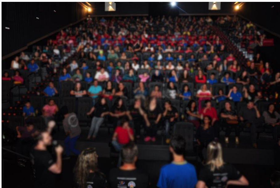
Imagem 2 – I Festival de Vídeo Estudantil de São Leopoldo / São Léo em Cine.