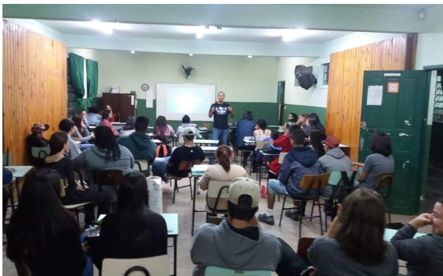
Imagem 3 – Oficina de produção de vídeo com alunos do Capão do Leão.

Ainda em 2016, uma nova parceria foi firmada, passando a Secretaria de Educação do município do Capão do Leão/RS, localizado próximo a Pelotas, a também organizar um festival de vídeo estudantil na cidade, seguindo os moldes dos festivais desenvolvidos nos demais municípios parceiros do projeto.