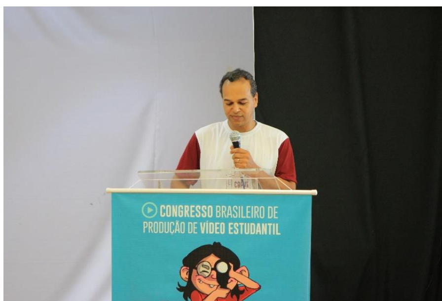
Imagem 4 – I Congresso Brasileiro de Produção de Vídeo Estudantil (2016).

Tal iniciativa propiciou um espaço de trocas com o intuito de compreender como a ação de fazer vídeo dentro do espaço educacional pode contribuir no processo de ensino-aprendizagem. Desde então, o CBPVE tem percorrido diferentes cidades e estados, sobretudo para possibilitar o crescimento de uma rede de discussões sobre a ação de produzir vídeo com os alunos. A primeira edição do evento ocorreu em 2016, junto à cidade de Pelotas, no campus do Centro de Artes da UFPel.