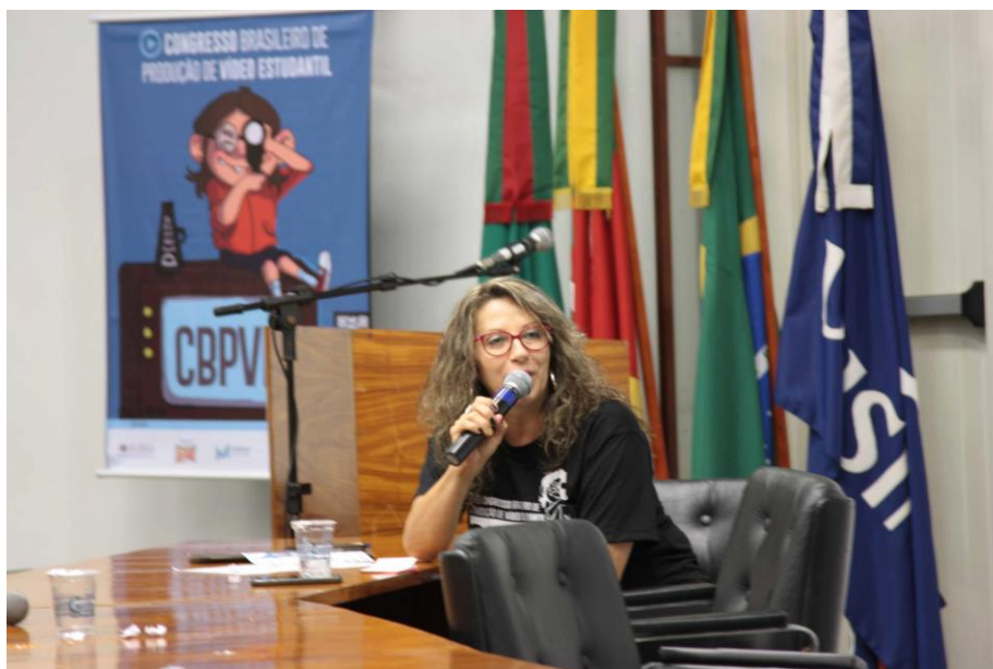
Imagem 5 – II Congresso Brasileiro de Produção de Vídeo Estudantil (2017).

No ano seguinte, em 2017, ocorreu a segunda edição do congresso, dessa vez na cidade de São Leopoldo/RS, com o apoio da Universidade do Vale do Rio dos Sinos (UNISINOS) e Universidade Federal do Rio Grande do Sul (UFRGS), parcerias necessárias para aumentar o alcance do projeto.