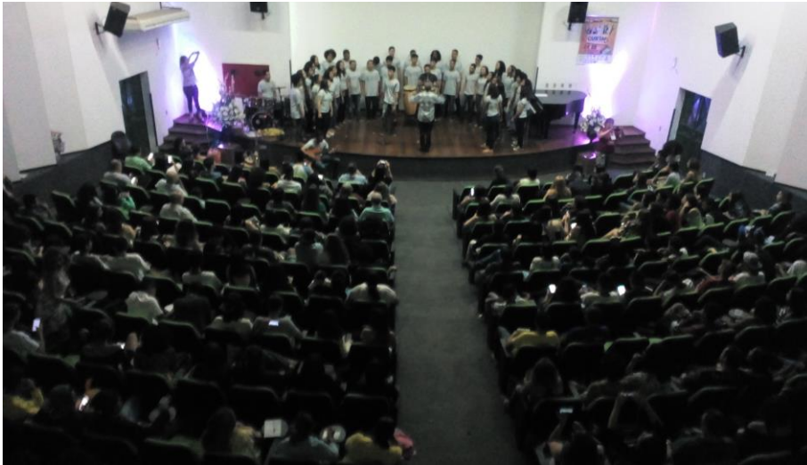
Imagem 6 – III Congresso Brasileiro de Produção de Vídeo Estudantil (2018).