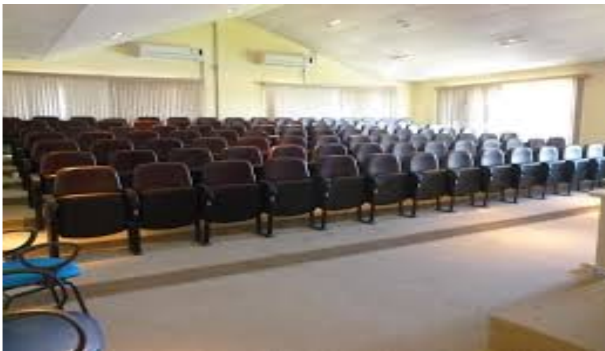
FIGURA 9: AUDITÓRIO NO 4º ANDAR DO CAMPUS ANGLO

Estão à disposição do Curso de Gestão Pública, também, dois auditórios no 4º do Campus Anglo, com aproximadamente 90 lugares cada, ambos climatizados; banheiros masculino e feminino (2 deles exclusivos a servidores), copa para servidores (anexa à reitoria) e duas salas com capacidade para 70 alunos.