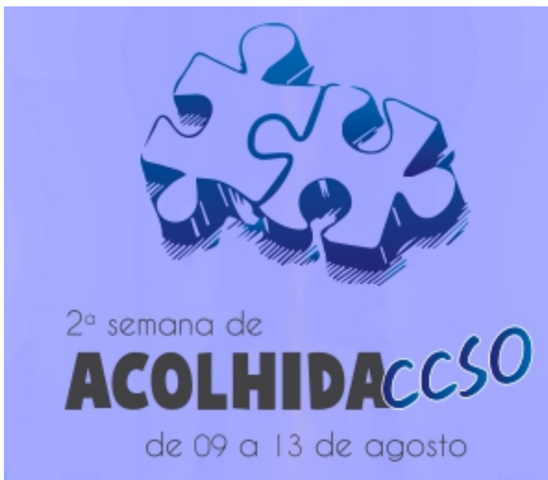
FIGURA 3: ACOLHIDA CCSO

Acolhida envolve a recepção dos ingressantes pela comunidade do CCSO, a prestação de informações sobre o funcionamento da universidade e seus diversos setores, um tour e apresentação da estrutura da Universidade, a realização de um piquenique de confraternização, entre outras atividades culturais e informativas em parceria com projetos de ensino, pesquisa e extensão da UFPel.