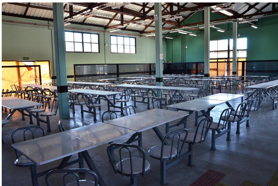
FIGURA 7: RESTAURANTE UNIVERSITÁRIO