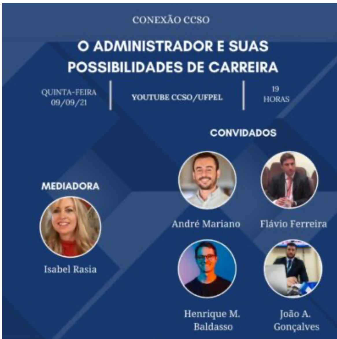
FIGURA 2: CONEXÃO CCSO

dos cursos de Administração, Gestão Pública, Turismo e Processos Gerenciais. Esta atividade é uma continuação do antigo Conexão FAT .