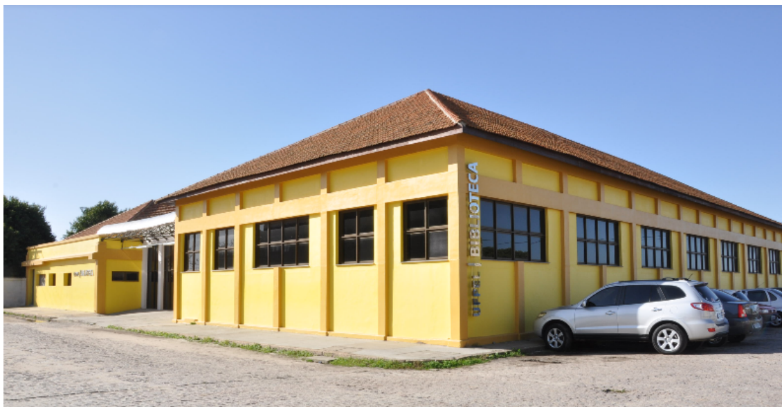
FIGURA 8: BIBLIOTECA DO CAMPUS ANGLO