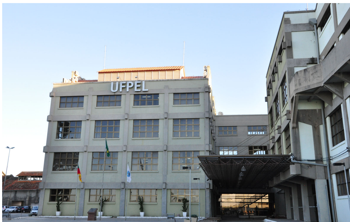
FIGURA 6: PRÉDIOS DO CAMPUS ANGLO