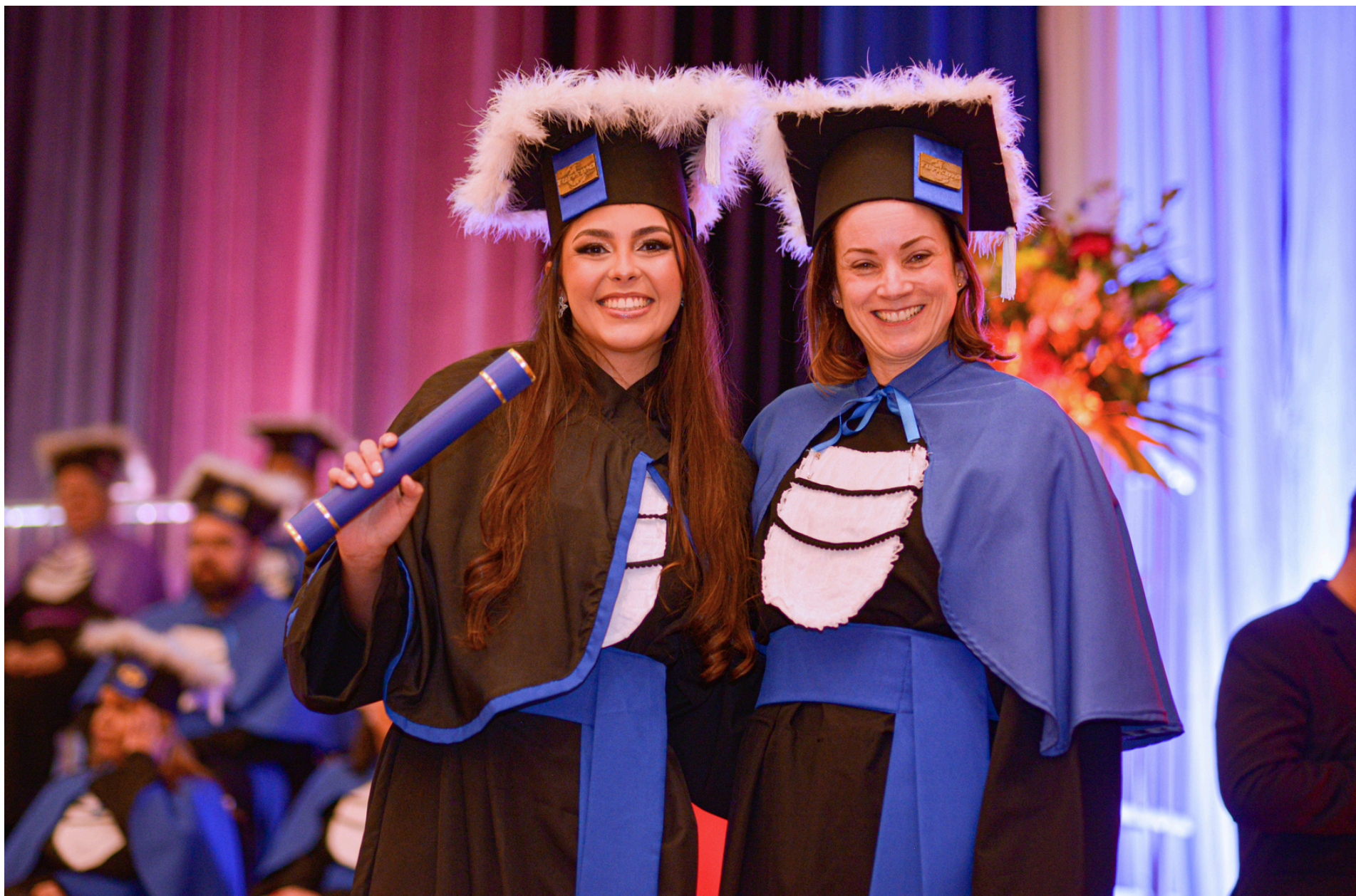
Formatura Institucional Externa Universidade Federal de Pelotas