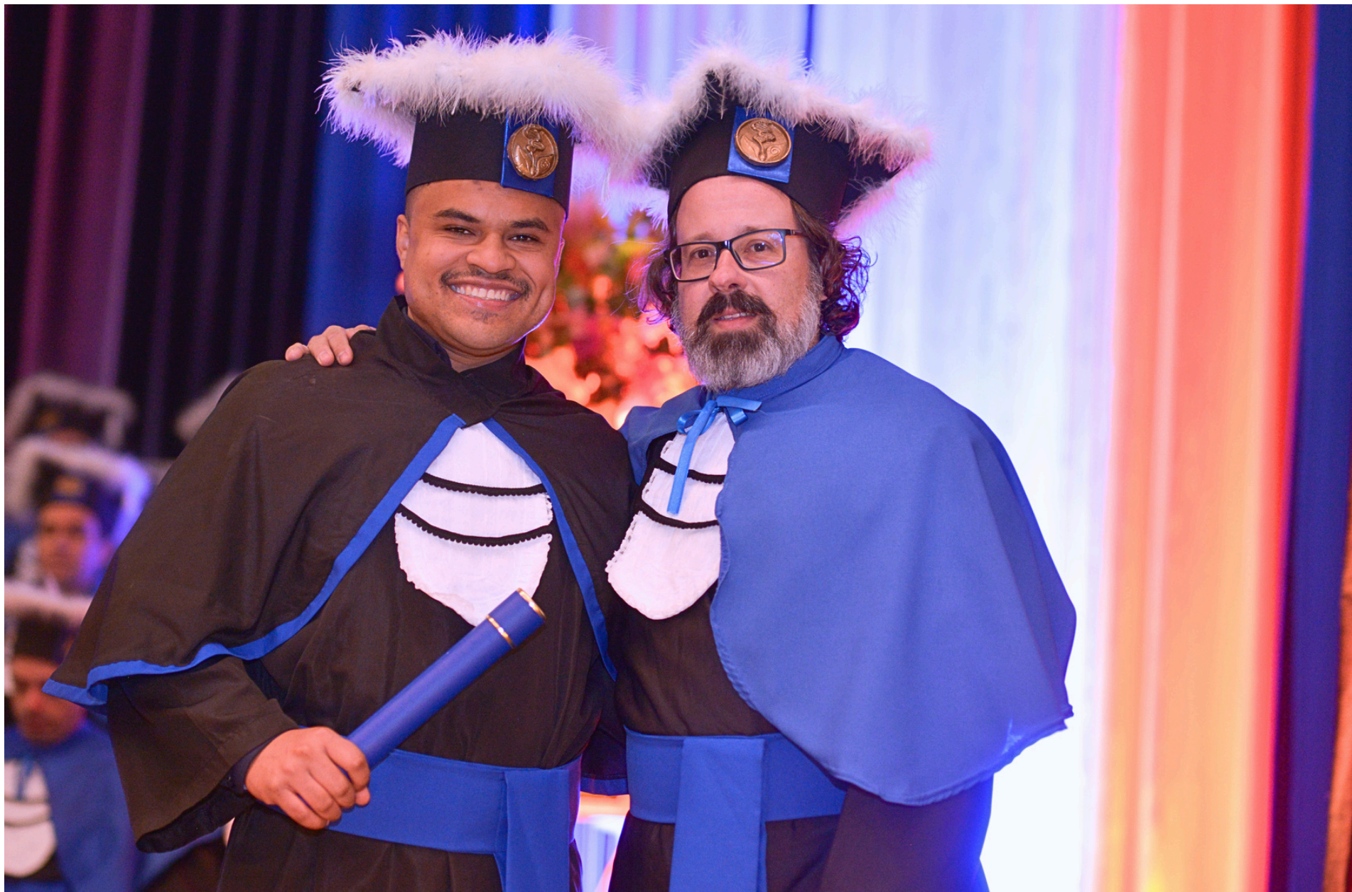
Formatura Institucional Externa Universidade Federal de Pelotas