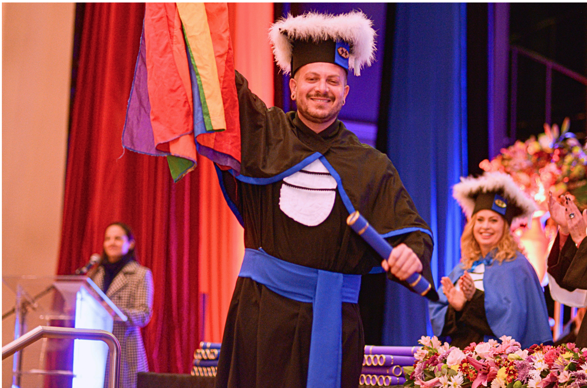
Formatura Institucional Externa Universidade Federal de Pelotas