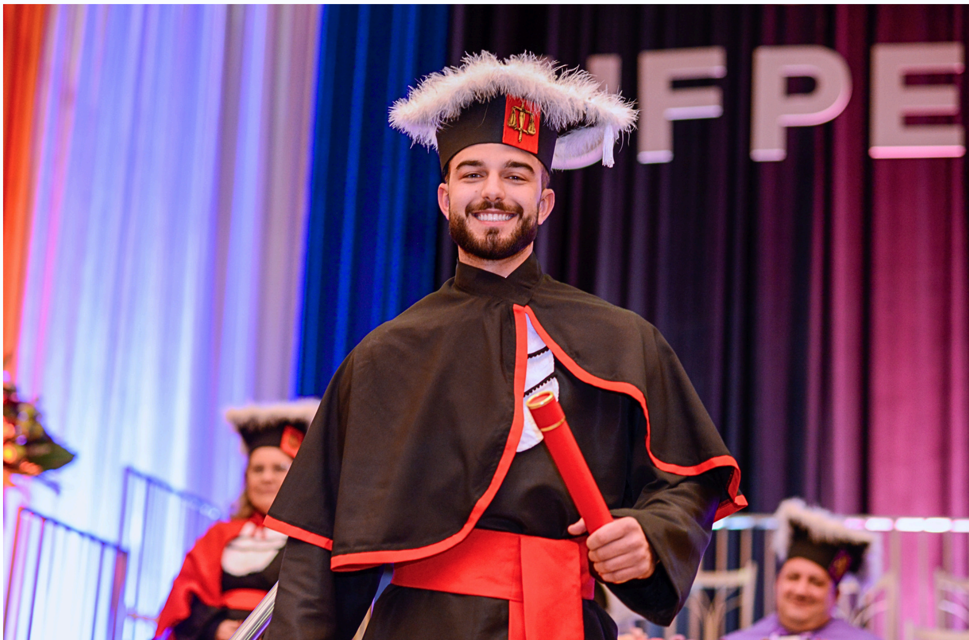
Formatura Institucional Externa Universidade Federal de Pelotas