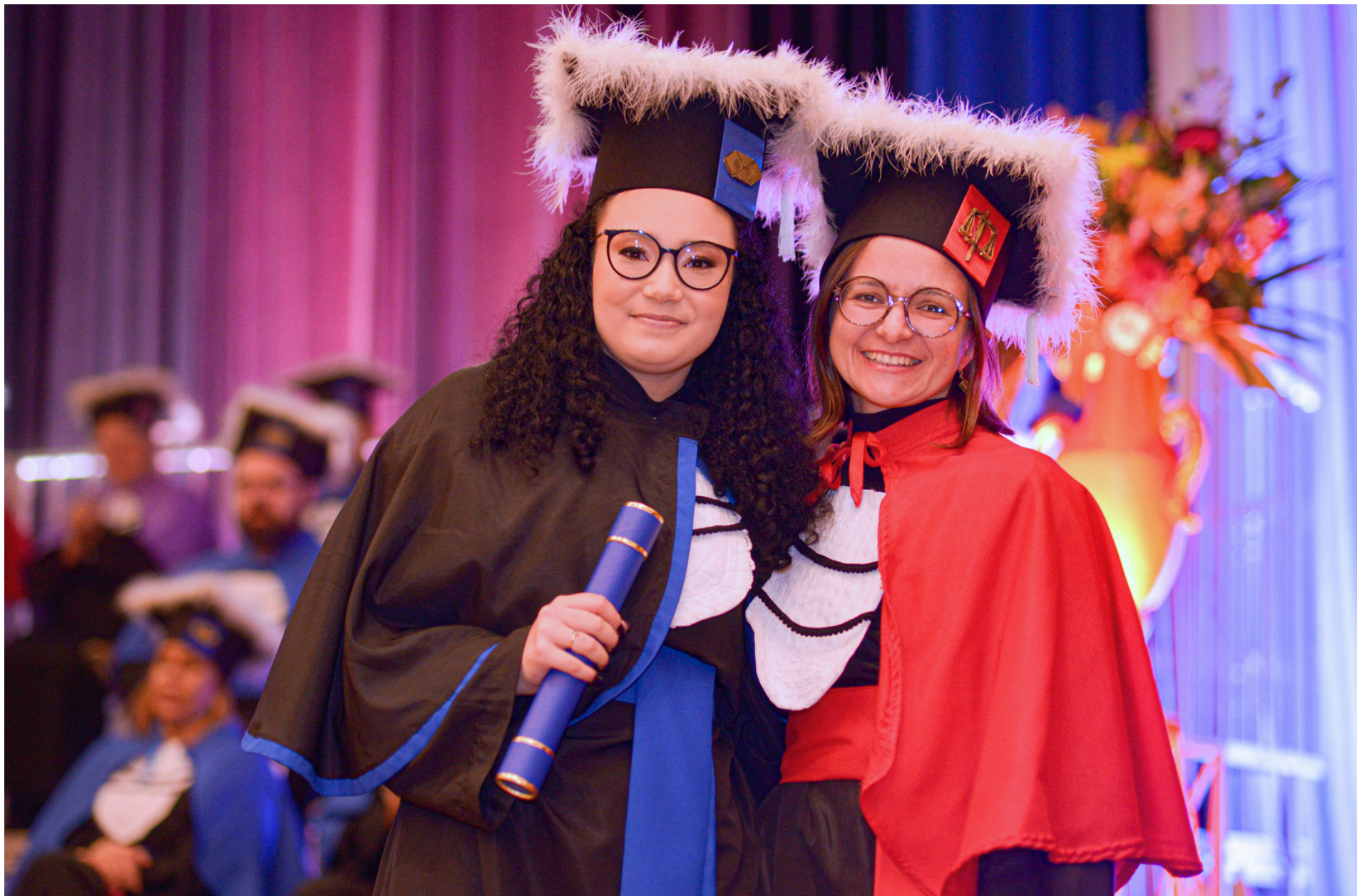
Formatura Institucional Externa Universidade Federal de Pelotas