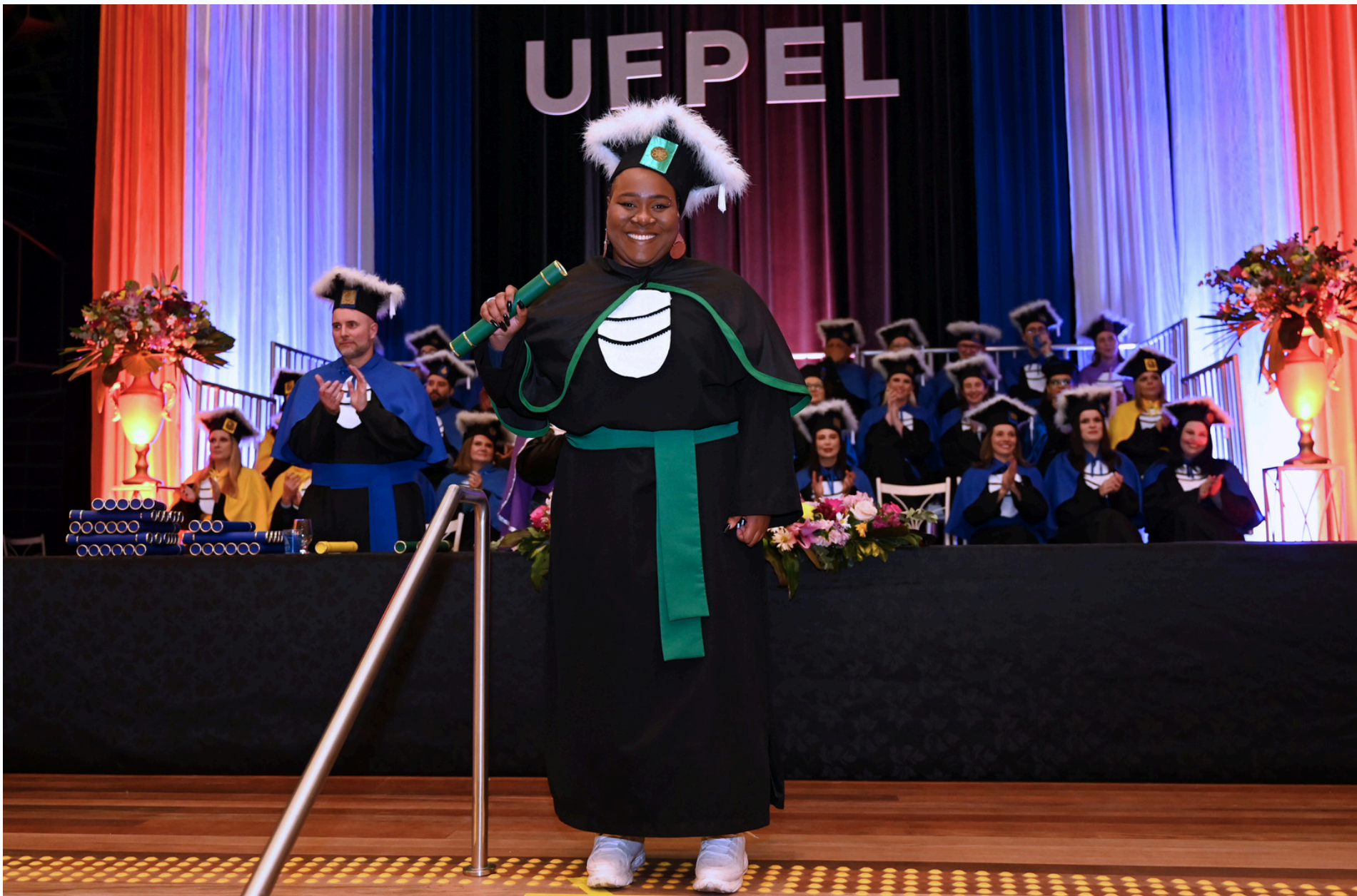
Formatura Institucional Externa Universidade Federal de Pelotas