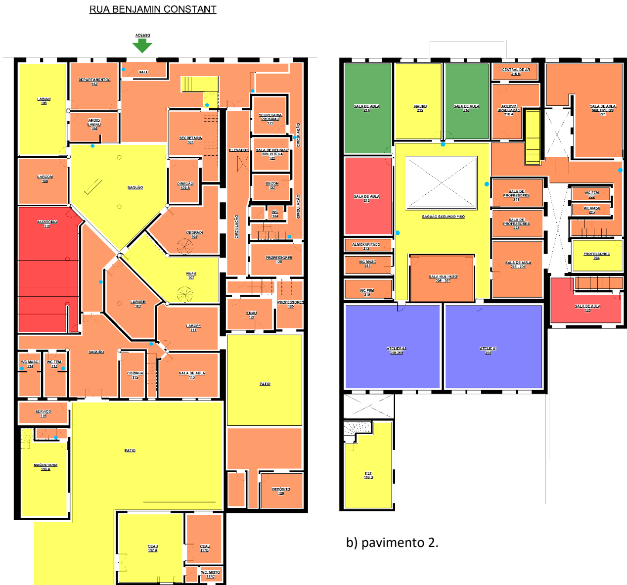
a) pavimento térreo.