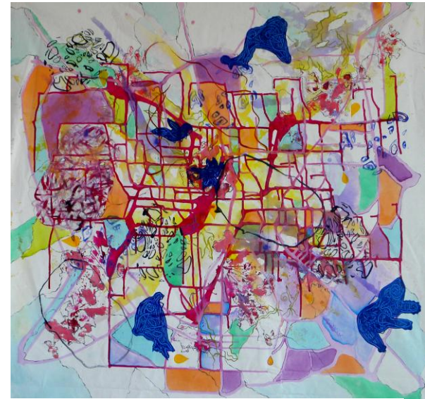
Imagem 5: Grupo Superfície. Somas III, 2011. Técnica mista, 100 cm x 95 cm.