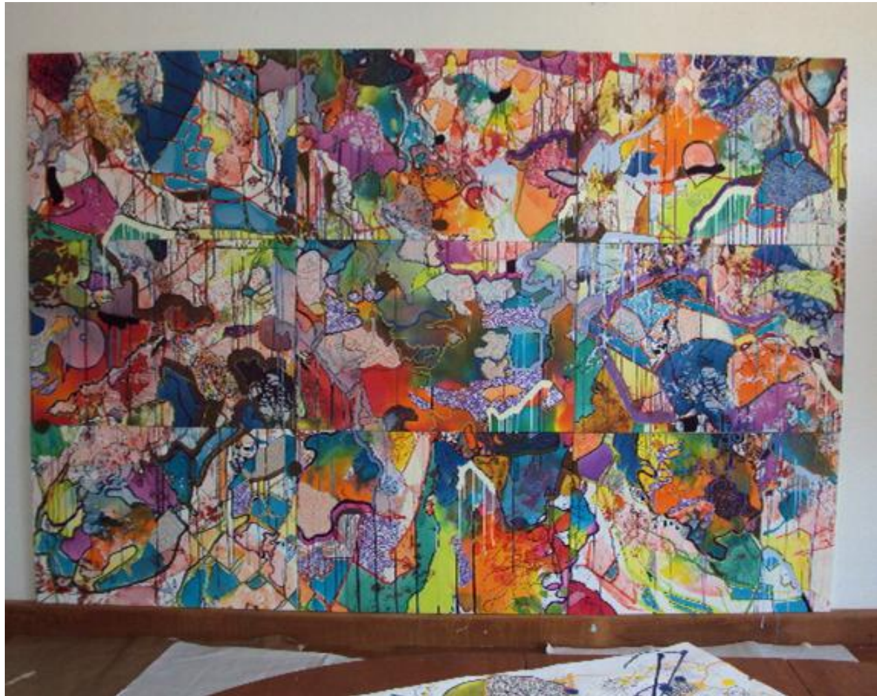
Imagem 25: Grupo Superfície. Fractal, 2011. Técnica mista sobre tela, (nove partes) 95 cmx 65 cm.

A ação de multiplicar uma em várias telas foi predominante nesta exposição e o