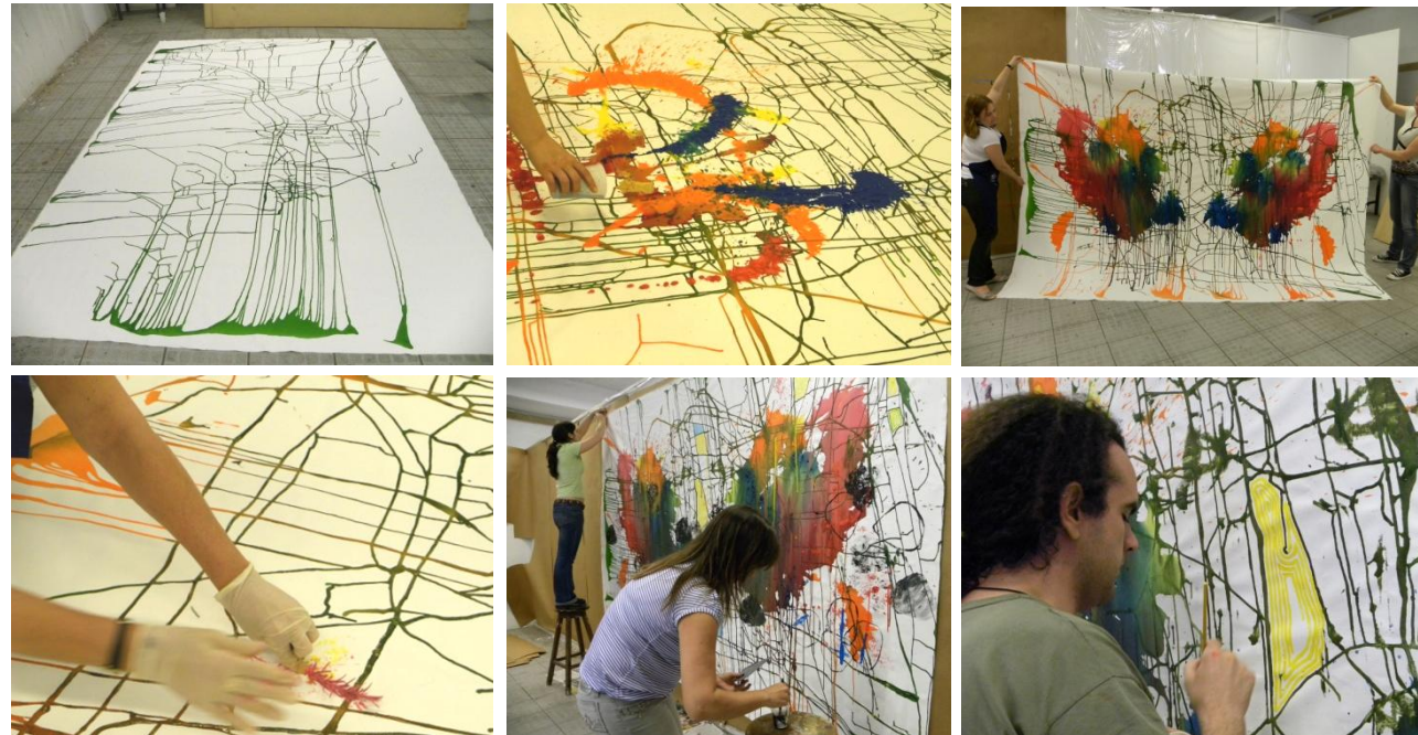
Imagem 3: Algumas etapas do processo "Interferências"

camada abaixo. Nesta ação, são resgatados do interior das manchas, cores que inicialmente haviam sido cobertas, são linhas de várias espessuras que formam um emaranhado colorido. Nesta pintura, além das ações provenientes do trabalho individual, tem elementos que foram criados especificamente para compor a pintura; o preenchimento de algumas partes com tinta aguada foi a solução encontrada para gerar