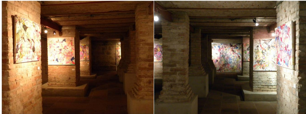
Imagem 9: Exposição Idiorritmia. Porão do Paço Municipal de Porto Alegre, 2011.

Nesta exposição, algumas pessoas que não nos conheciam queriam saber quem era a autora das pinturas. Alguns não entendiam que se tratava de um trabalho coletivo, achavam que era uma mostra coletiva onde cada uma de nós tinha feito o seu próprio trabalho ou, ainda, que fossem trabalhos de uma única pessoa, pelas características da pintura. O nosso processo foi acontecendo e não tínhamos parâmetros semelhantes de comparação com o processo de outros artistas, a autoria de cada uma de nós foi se diluindo por completo, em benefício de uma nova identidade, uma identidade que é coletiva, mas é unitária quanto ao resultado.