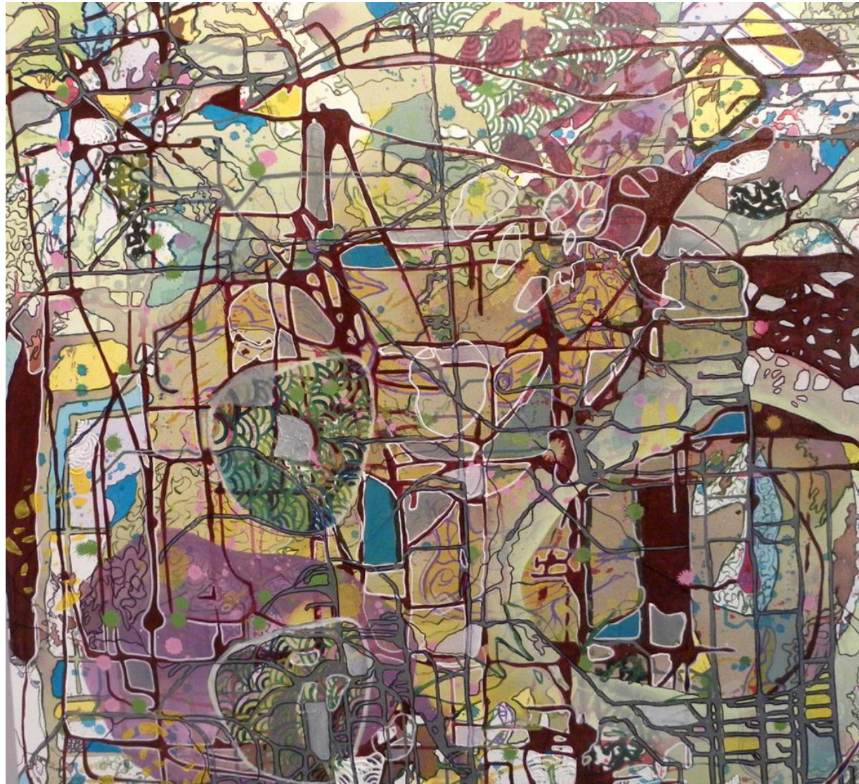
Imagem 8: Grupo Superfície, Interconexões I, 2011. Técnica mista, 100 cm x 100 cm.