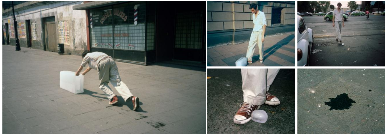
Imagem 21: Francis Alys 1997. Paradoxo of Praxis 1 (Sometimes Doing Something Leads to Nothing) 8 .

O artista demonstrou que às vezes fazer alguma coisa pode não levar a nada muito concreto. Este rastro efêmero, no entanto, para alguns pode significar simplesmente uma maneira de inutilizar uma ação, mas por uma ótica mais atenta esta ação segue se desdobrando em significados, que através da arte se põe latente, diferenciando uma ação cotidiana de uma ação no campo da arte.