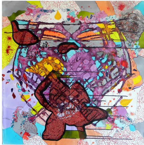
Imagem 6: Grupo Superfície. Somas I, 2011. Técnica mista, 100 cm x 95 cm.