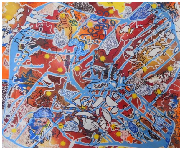
Imagem 16: Carla Borin, Sete por um, 2011. Técnica mista, 60 cm x 60 cm.