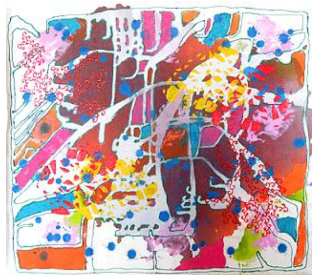
Imagem 19: Paloma De Leon, Sete por um, 2011. Técnica mista, 60 cm x 60 cm.