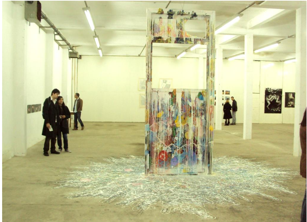
Imagem 12: Grupo Superfície/Jorge Lagos. Vicus, 2011. Técnica mista, 340 cm x 150 cm.

Uma proposta pode ser amplamente desdobrada, fomos percebendo isso como um elemento que nos possibilita um maior conhecimento sobre o fazer compartilhado, as ideias vão surgindo e sendo colocadas em jogo, mas nem todas são realizadas, aliás,