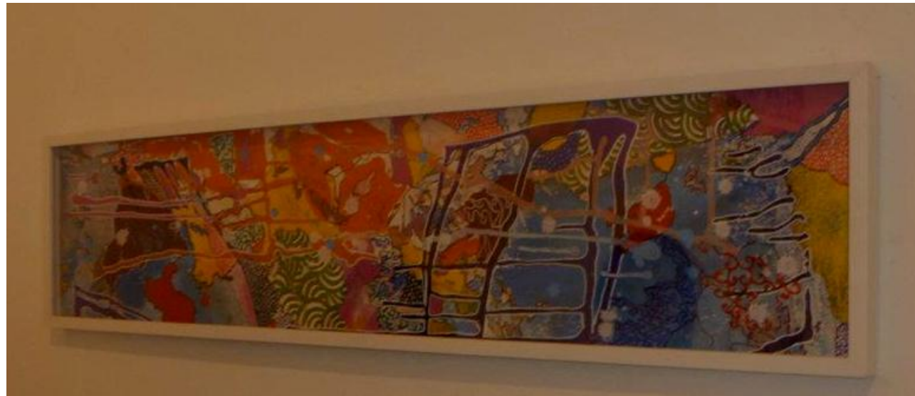
Imagem 23: Grupo Superfície, 2012. Projeto Mauá 30 cm x 120 cm.

produzindo no ateliê, com as interferências, ações compartilhadas, liberdade na escolha das cores, enfim, tínhamos uma imagem de referência de uma pintura que foi escolhida previamente como projeto para o muro, mas a falta de experiência em pintar parede não era o único diferencial. Com a tela, temos mobilidade, ela é dobrável, pode ser manipulada tanto na horizontal, quanto na vertical, podemos movimentá-la para conduzir os escorridos e provocar manchas. No entanto, quando nos deparamos com o muro, completamente áspero e cheio de irregularidades na sua superfície, um espaço de doze metros de comprimento por três de altura, nos demos conta que teríamos que nos adaptar àquela realidade e que as diferenças seriam maiores do que estávamos imaginando.