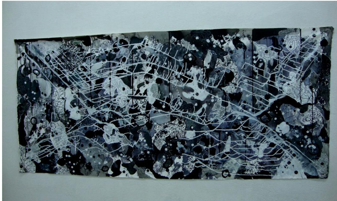
Imagem 13: Grupo Superfície, Monocromos, 2011. Acrílica sobre tela, 220 x 110 cm.

Nomeamos o trabalho de Monocromos, este experimento em preto e branco, ainda nos motivou a realizar posteriormente desenhos nestes tons. Ideias que estão guardadas, foi apenas uma pequena pausa para as cores que logo voltaram. Acredito que será retomada ainda esta possibilidade ou será incorporada de alguma nova forma, mas o colorido ainda é o que nos move com maior força na realização das pinturas.