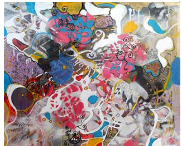
Imagem 17: Daniela Meine. Sete por um, 2011. Técnica mista, 60 cm x 60 cm.