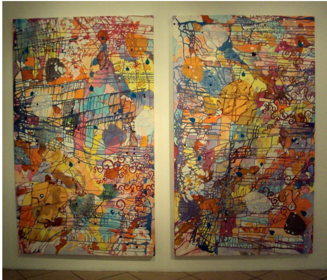
Imagem 28: Grupo Superfície. Paralelas, 2012. Técnica mista sobre tela, Díptico, 220 cm x 130 cm.