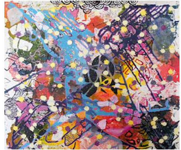
Imagem 15: Carla Thiel. Sete por um, 2011. Técnica mista, 60 cm x 60 cm.