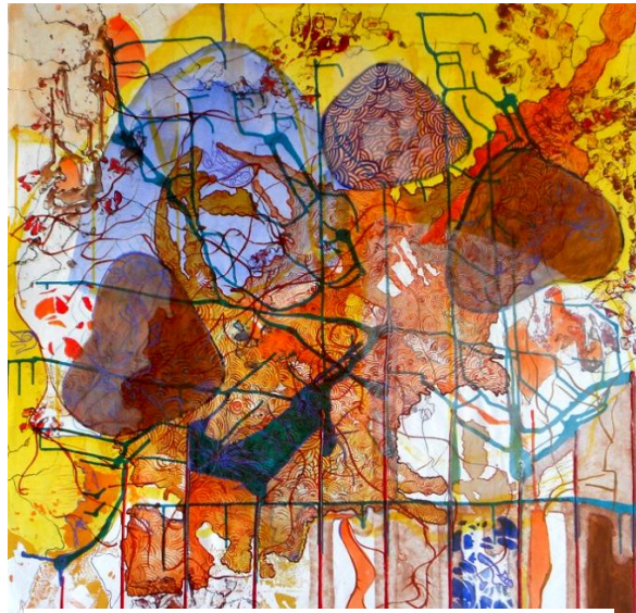
Imagem 4: Grupo Superfície. Somas IV, 2011. Técnica mista, 100 cm x 95 cm.

As histórias narradas não foram nosso mote, mas a metalinguagem, algo que esta para além do conteúdo, na forma. Identificamos nos textos um tempo suspenso e tenso, onde ele capta a atenção do leitor de modo que este se transporte para dentro da história, transcendendo para este lugar que nos é familiar, pois seus contos e lendas fazem parte do imaginário coletivo de quem é desta região. Buscamos questões como: tempo, espaço, não linearidade, sobreposição, apagamento, justaposição, lúdico, inusitado, entre outras, que tinham relação com o tipo de trabalho que estávamos dispostas a fazer em pintura, esta relação se tornou possível do ponto de vista estrutural, sem perdermos nossas poéticas individuais, trazendo questões que nos eram importantes.