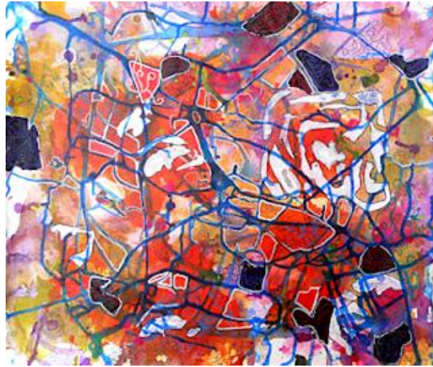
Imagem 14: Adelina Lintzmaier. Sete por um, 2011. Técnica mista, 60 x 60 cm.