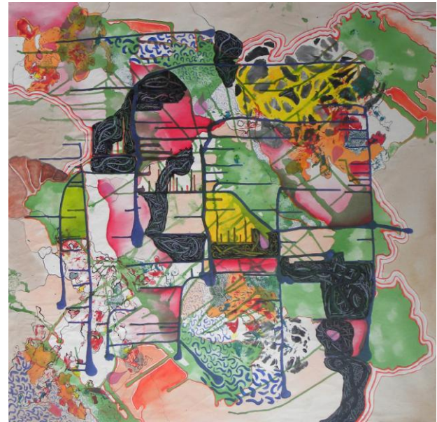
Imagem 7: Grupo Superfície. Somas II, 2011. Técnica mista, 100 cm x 95 cm.

Esses trabalhos que medem aproximadamente um metro quadrado se assemelham por características recorrentes como: todos possuem maior acúmulo de ações no centro da tela, a sobreposição de elementos ainda é discreta, as ações de cada integrante podem ser identificadas e a tela não é totalmente coberta com tinta. As linhas são evidenciadas em todas as ações, linhas que contornam manchas, linhas escorridas e que cruzam toda superfície da tela, linhas desenhadas que formam tramas, linhas que são arranhadas formando sulcos nas camadas de tinta, que preenchem espaços e outras que sobrepõem, que ligam elementos, linhas que trazem o gesto distinto de cada