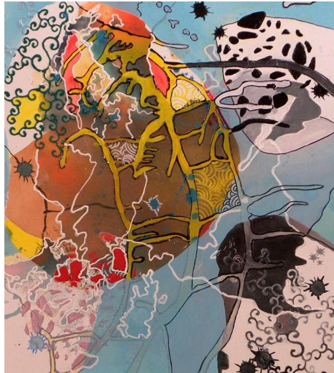
Imagem 27: Grupo Superfície. Núcleos, 2012. Técnica mista sobre tela, 56 cm x 49 cm.

A pintura assumiu novas características, fruindo de todo um saber constituído provindo das várias etapas que o processo vem nos conduzindo, longe de considerar uma etapa melhor ou pior, mas fomos assumindo maior consciência no percurso da criação compartilhada, pode se dizer que é um novo passo dado.