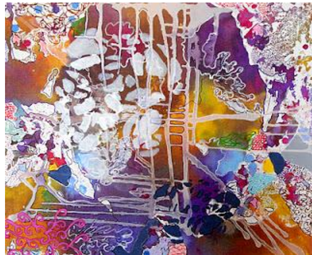
Imagem 20: Mariza Fernanda, Sete por um, 2011. Técnica mista, 60 cm x 60 cm.