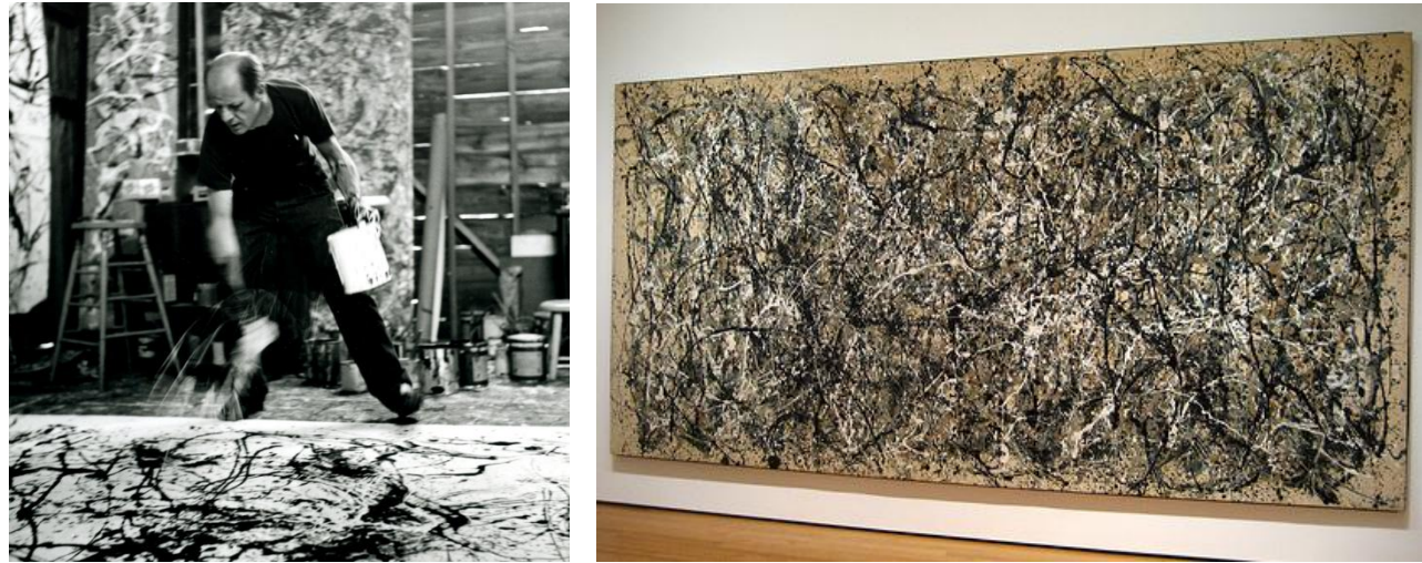
Imagem 22: Jackson Pollock. Numero 8, 1949. Óleo e esmalte sobre tela, 210 x 480 cm.

As ações aparecem distintas, como se fosse possível perceber o gesto que forma cada detalhe da pintura, diferenciando as camadas que são sobrepostas, mas por serem pingos, linhas, manchas, não cobrem toda superfície, e por isso geram um emaranhado sobre a tela. O modo de fazer, e o processo, podem ser entendidos ao observarmos as direções que as tintas foram jogadas, onde esta atingiu com maior excesso e produziu o primeiro contato com a tela, até a sua diminuição formando uma linha fina e gotículas pequenas, proveniente de um gotejamento que pelo impacto com o suporte. Estas questões estão presentes na pintura, formando um múltiplo na superfície assim como retrata o historiador Giulio Carlo Argan sobre as pinturas de Pollock: