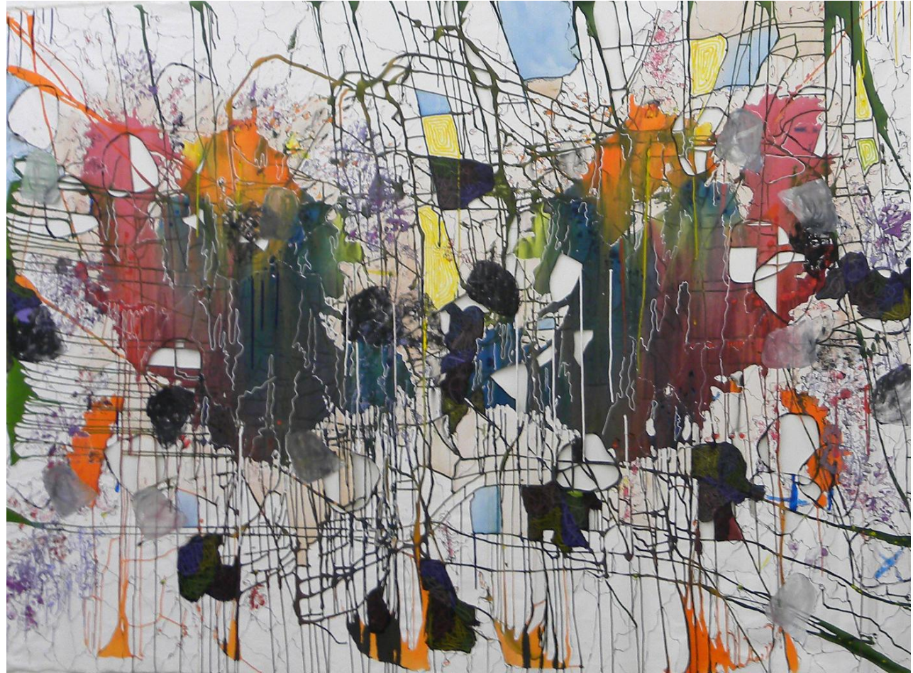
Imagem 2: Grupo Superfície. Interferências, 2010. Técnica mista, 300 cm x 210 cm.

superior pelo processo coletivo. A aproximação de nossas poéticas reverberou em nós de modo positivo.