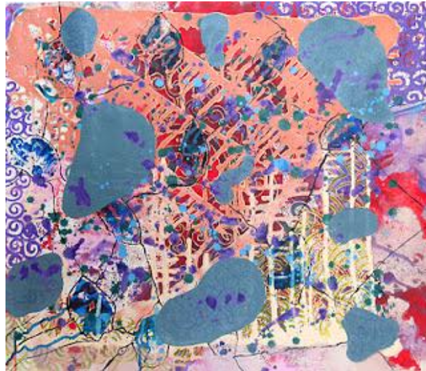
Imagem 18: Natália Hax. Sete por um, 2011, Técnica mista, 60 cm x 60 cm.