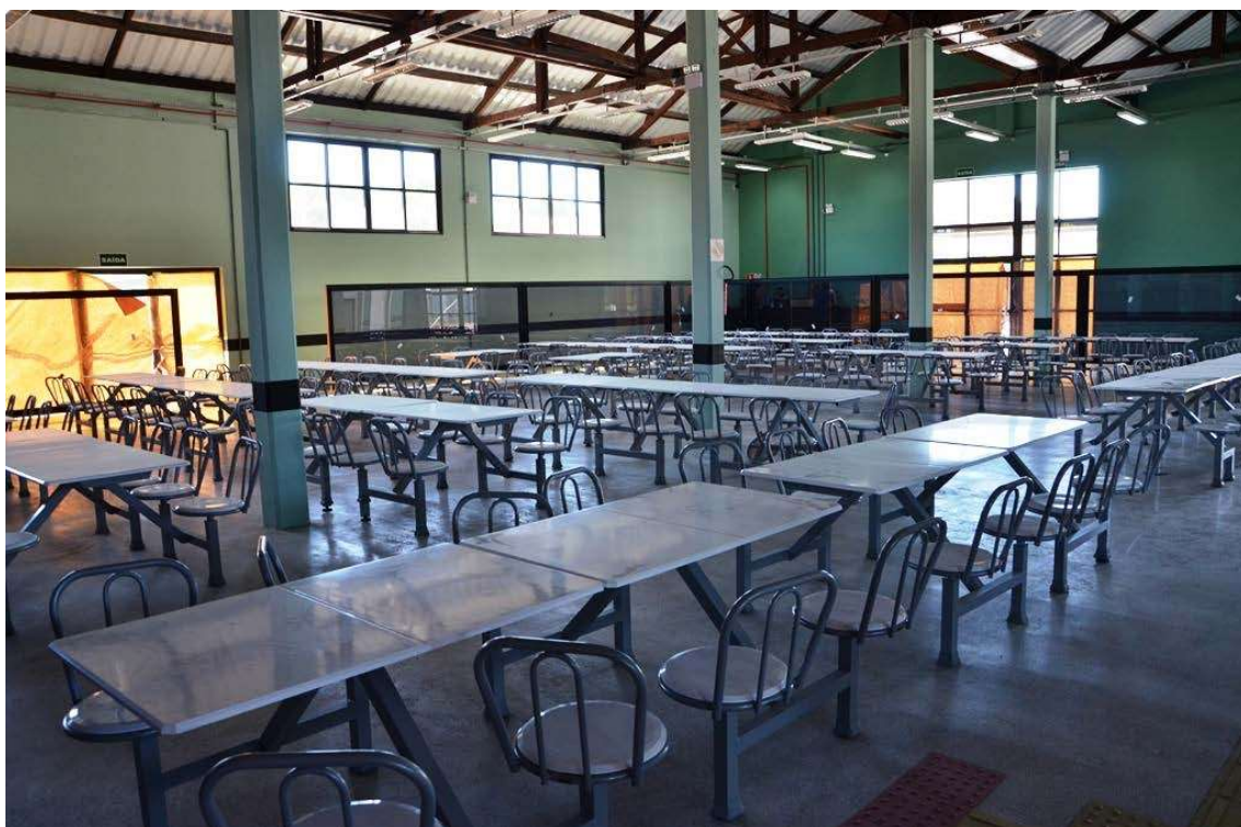
Figura 3: Restaurante Universitário