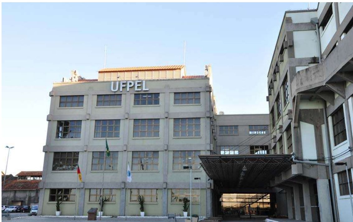
Figura 2: Prédios do campus Anglo