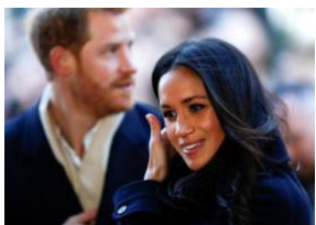
Cinco coisas às quais Meghan Markle renunciará para se casar com o príncipe Harry