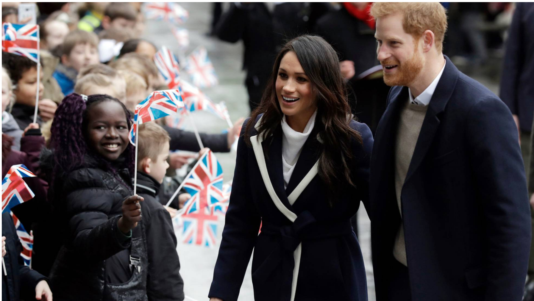
O príncipe Harry e Meghan Markle, em 8 de março