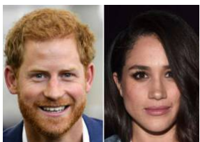
Negra, estrangeira e livre, Meghan Markle é o que a realeza britânica precisava para 2017