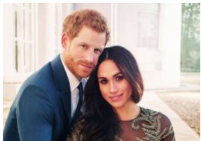
Primeiro retrato oficial de Meghan Markle com o príncipe Harry