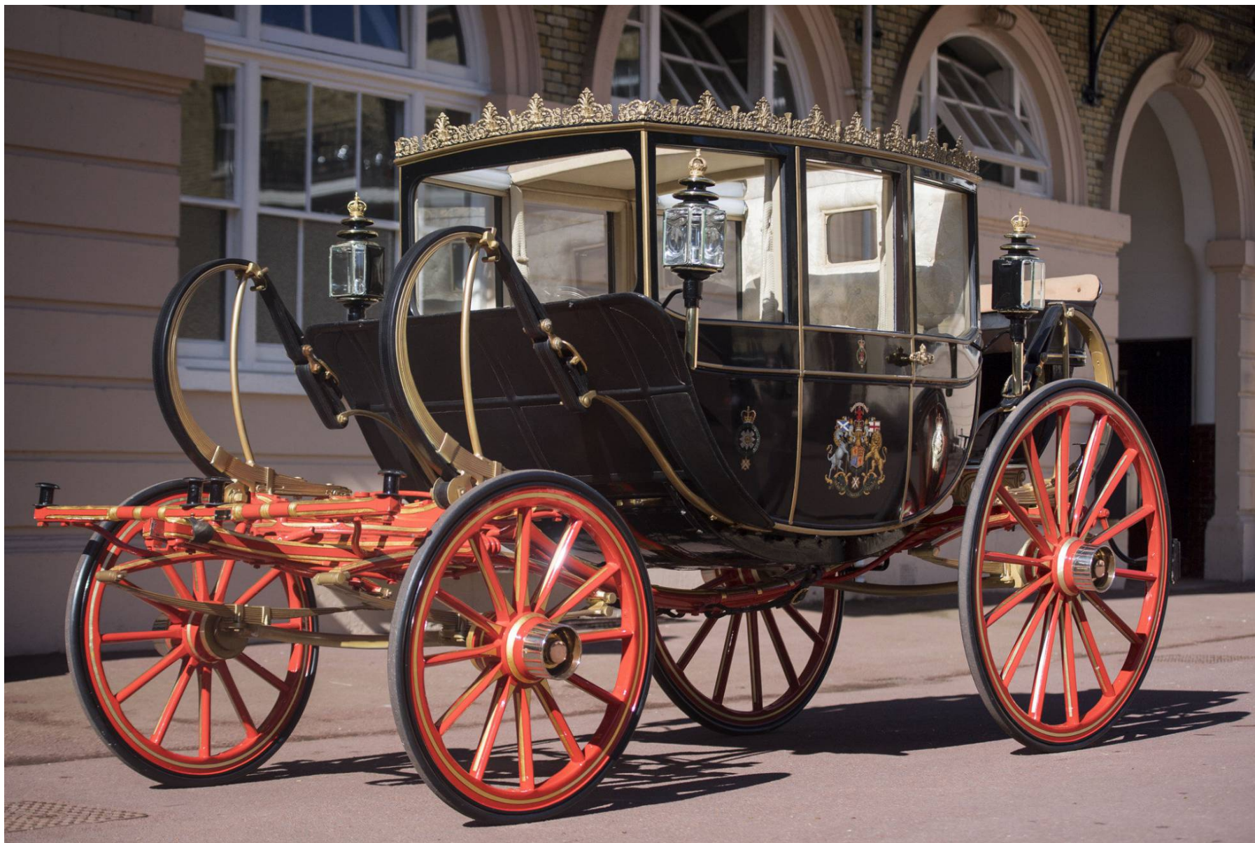
A carruagem escolhida por Meghan Markle para chegar à capela no dia do seu casamento