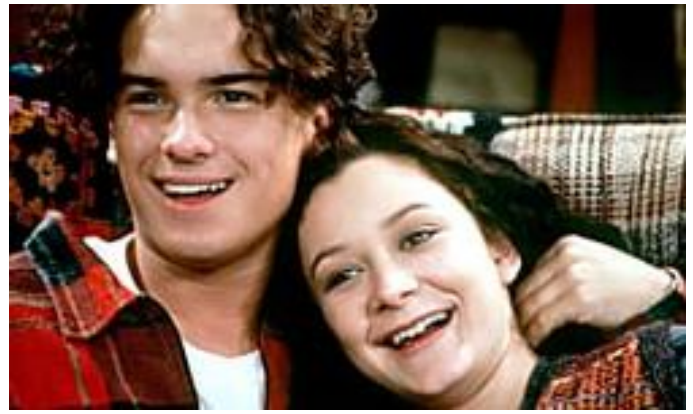
Johnny Galecki de...