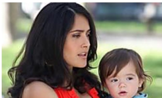
La hija de Salme...