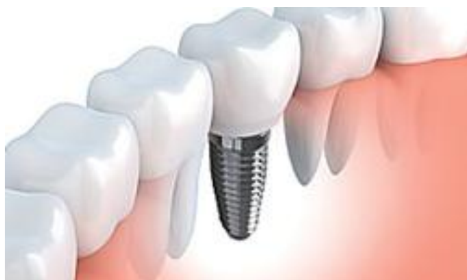
Aquí está lo que los...