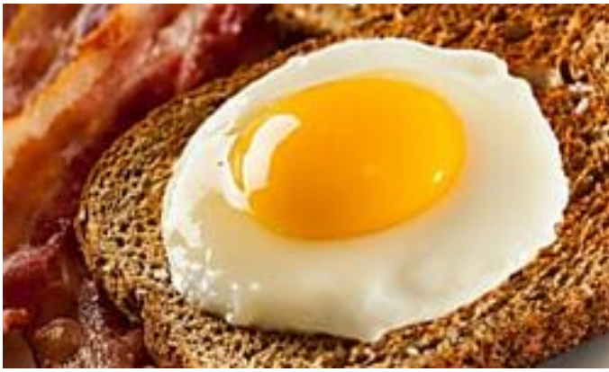
Alimentos que han...