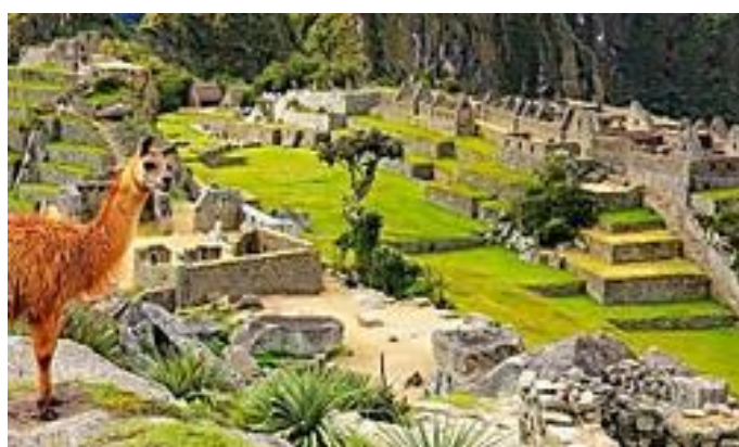
¡Realiza el quiz de los...