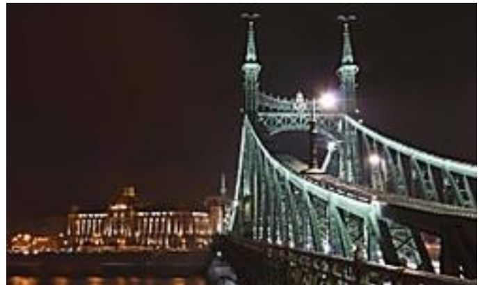
Del cachopo a los...