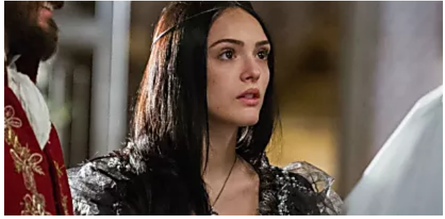
Morte surpreendente em “Novo Mundo” deixará todo mundo chocado na novela