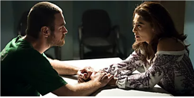
“A Força do Querer” terá passagem de tempo: saiba o que mudará na novela