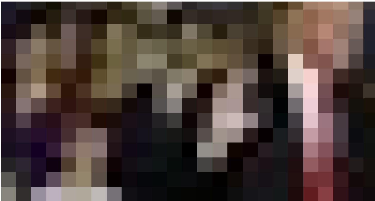
Donald Trump fala nesta segunda-feira (24) sobre o programa de saúde dos EUA em frente a 'vítimas do Obamacare'