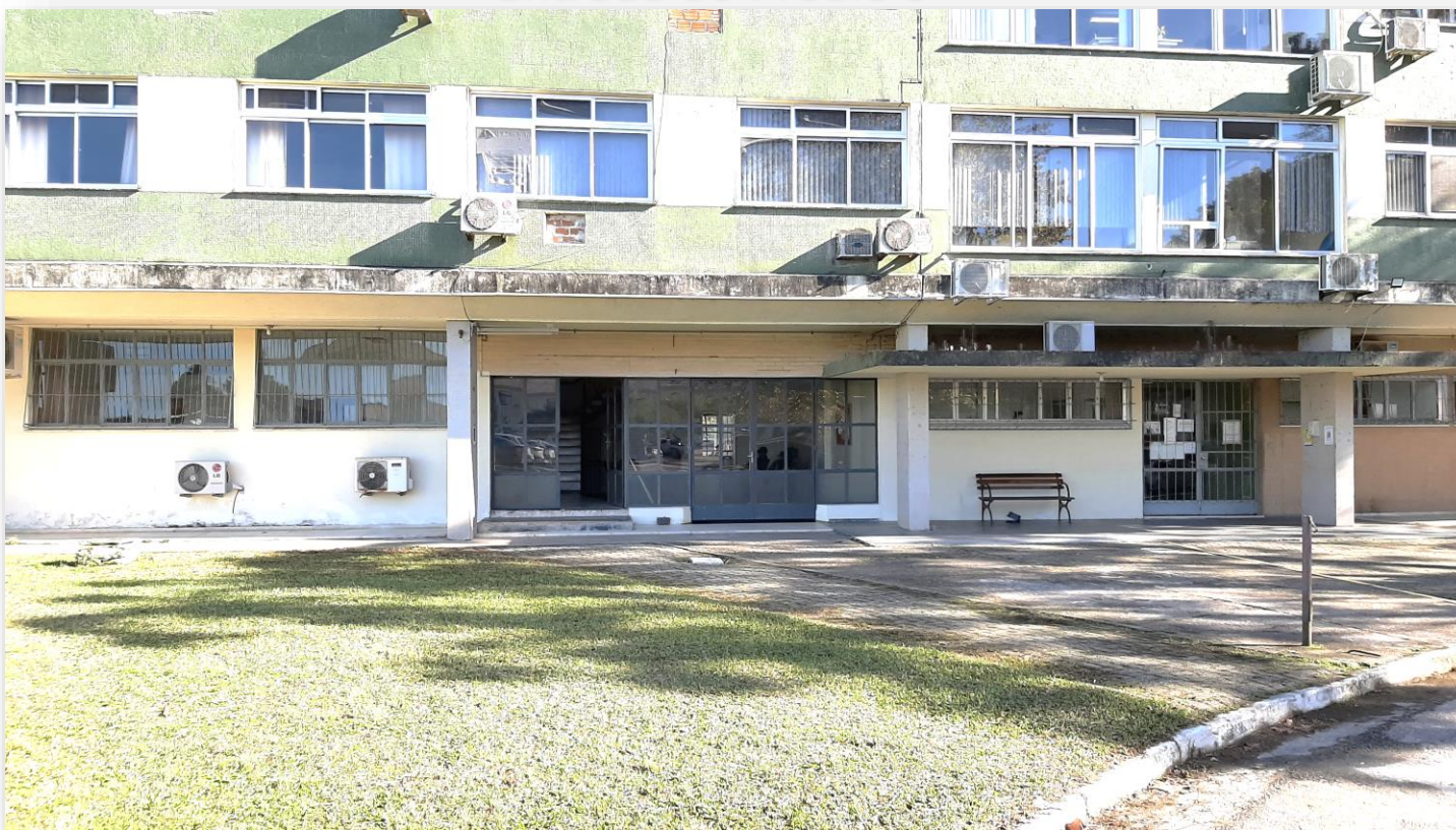
Entrada do Prédio 5