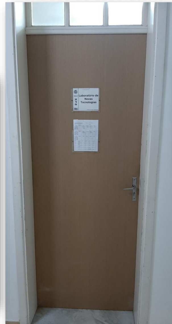
Entrada do Laboratório