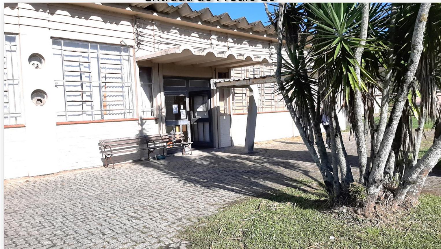
Entrada do Prédio 16