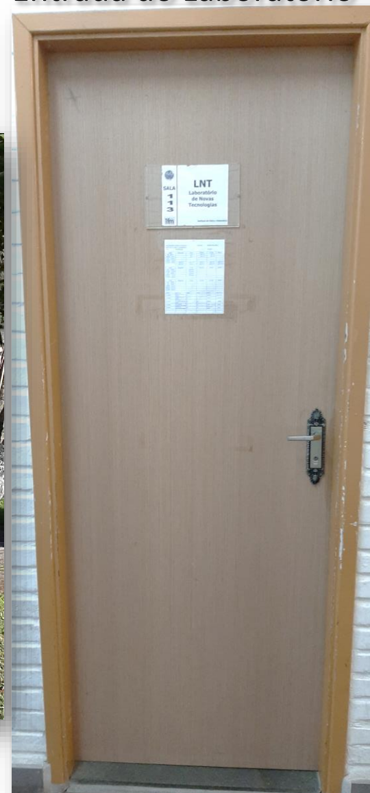
Entrada do Laboratório