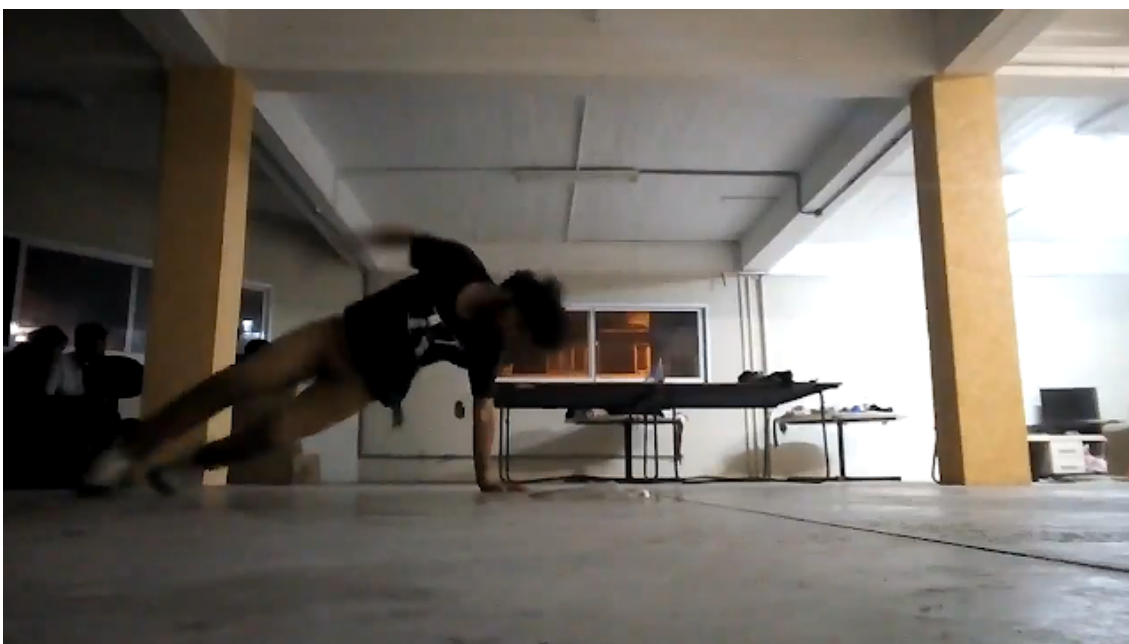
Figura 4 - Ensaio na Casa do Estudante da Ufpel.

A escolha de três ensaios por semana foi definida pela disponibilidade de tempo, e me proporcionou tempo adequado para a realização desta pesquisa específica. Além disso, durante a pesquisa, desenvolvi outros trabalhos relacionados à Dança de Rua, os quais contribuíram para este projeto. Sempre busquei estar em movimento como bailarino e professor de dança e permiti que estes outros trabalhos atravessassem minha forma de dançar e meu pensamento sobre minha dança. Como bailarino estudo e aprendo movimentações novas que sempre contribuem para meu repertório de movimentos. Como professor eu tenho a possibilidade de explorar formas de construção coreográfica e costura de movimentos o que me auxiliou na produção do meu solo.