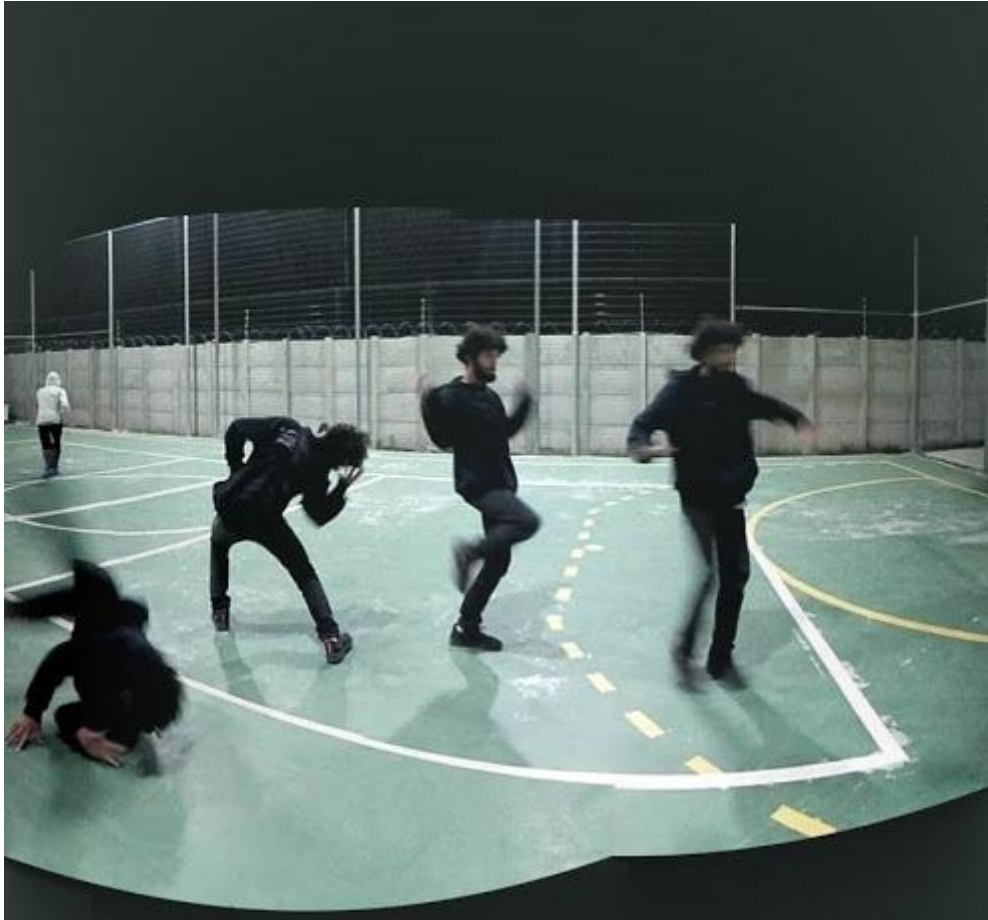
Figura 8 - Eu, Vento em processo.

Tendo todos os pontos acima citados no corpo, comecei experimentando as das movimentações citadas, as quais me proporcionaram uma segurança assim como as Party Dances 24 e movimentações específicas de cada Subgênero das Danças de Rua. Para compreender melhor, a seguir eu trago uma descrição do trecho inicial do processo coreográfico, de que forma eu pensava cada criar, de onde eu partia, quais eram as barreiras e para onde eu e o vento seguia.