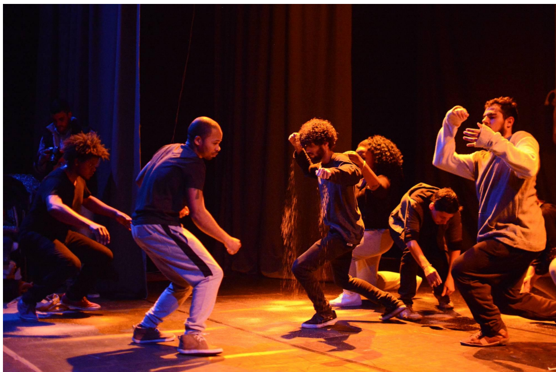
Figura 2 - Espetáculo Relógio de Areia (2016).

Areia”. Os trabalhos com a REC 5 influenciam muito o meu processo de criação em dança como também a minha estética de movimentação em Dança.