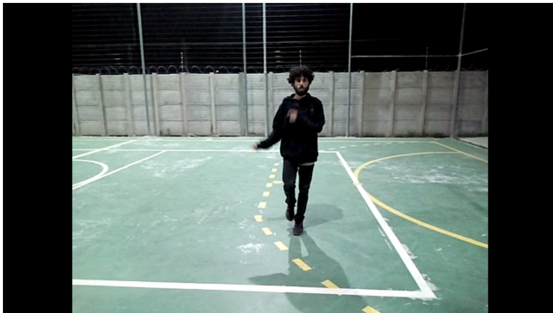
Figura 7 - Movimentação de pedaços.

“Pedaços” é quando movimento partes do corpo isoladas em sequência, começa no ombro vai para o outro em seguida para o tronco, para pernas e braços até mesmo para cabeça. Este relacionou-se com Isolation do Popping (CAMARGO, 2013).