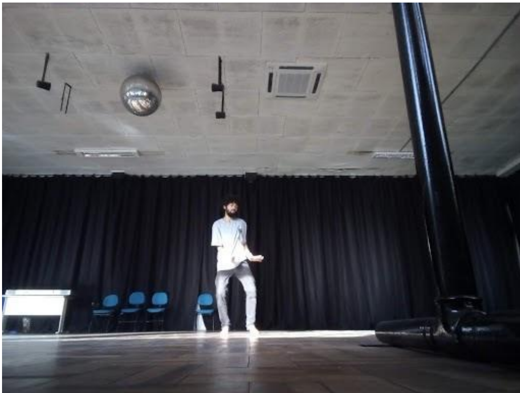
Figura 5 - Soprar.

O soprar é uma movimentação que têm a respiração como foco principal, esse movimento acontece diversas vezes em conjunto de outros, mas sua principal característica é quando eu expiro ar com força e por um tempo razoável, em média 3 a 5 segundos, e eu desacelero todos os outros movimentos que estão acontecendo em conjunto. Nessa movimentação é como se eu tomasse o vento ambiente para mim e esta é a coisa mais importante no momento, eu sinto como se todo o ar saísse do meu corpo e eu me torno pesado. Como na foto abaixo na qual eu inspiro, trazendo ar para dentro do meu corpo, e desenhando o caminho do ar em meu corpo, para logo em seguida expirar e empurrar o ar para fora e utilizo as mãos para mostrar o vento saindo.