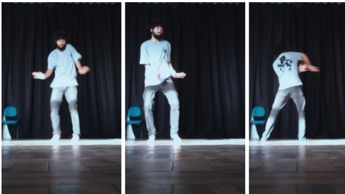
Figura 9 - Recomeço.

esticar o braço contínuo, recolhê-lo de forma súbita, em seguida uma rotação com a cabeça e interrompê-la com uma contração no abdômen junto de esticar os braços por meio de um Waving. São todos gestos pequenos que conversam muito com a movimentação de pedaços e executei eles diversas vezes até recomeçar com soprar.