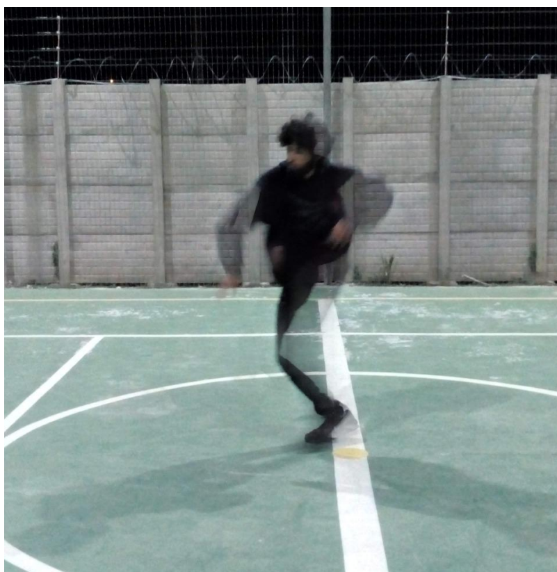
Figura 6 - Desviar.

Um terceiro conjunto de movimentos eu chamo de desviar. É uma movimentação no qual eu sinto como se o vento batesse em mim e fizesse meu corpo mudar de direção, ou somente o vento vem em minha direção e eu não deixo ele me tocar outras vezes faço ele utilizando as mãos, quando ela bate no meu peito eu mudo a direção.