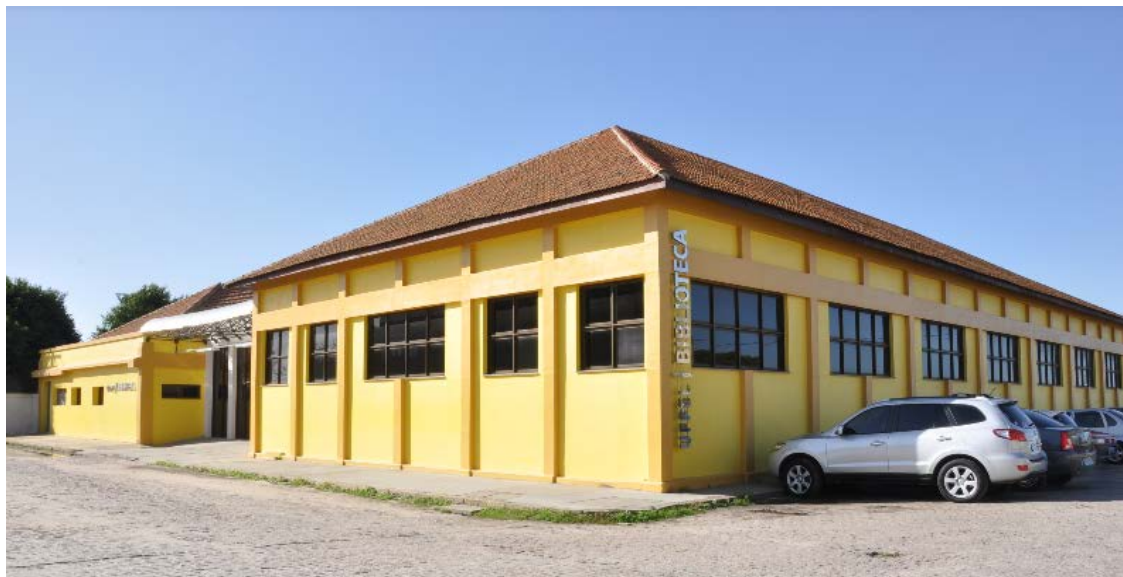
Figura 4: Biblioteca do Campus Anglo

laboratório de informática do 4º andar, compartilhado com outros cursos alocados no mesmo prédio.