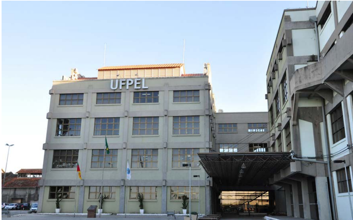
Figura 2: Prédios do campus Anglo