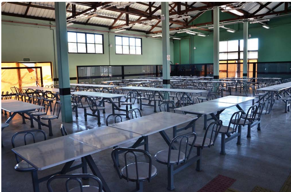
Figura 3: Restaurante Universitário