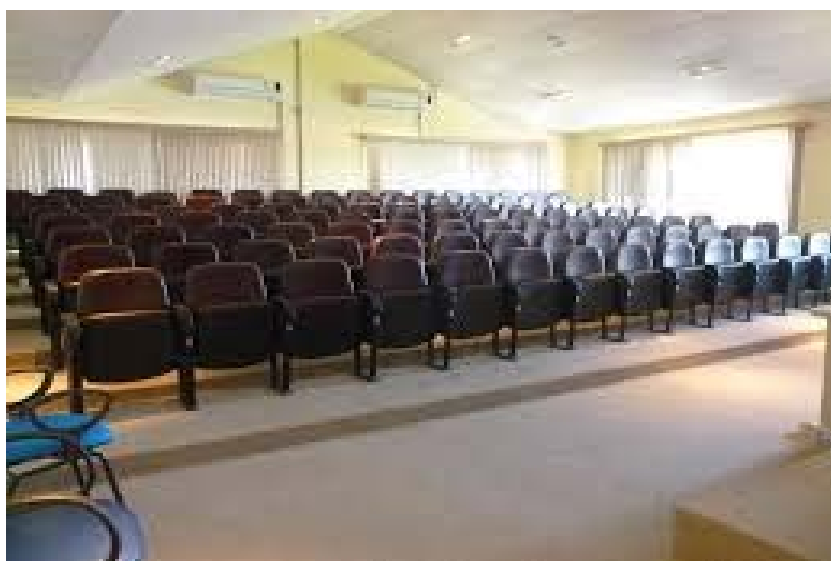
Figura 5: Auditório no 4º andar do Campus Anglo

Estão à disposição do Curso de Bacharelado em Administração, também, dois auditórios no 4º andar do Campus Anglo, com aproximadamente 90 lugares cada, ambos climatizados; banheiros masculinos e femininos (2 deles exclusivos a servidores), copa para servidores (anexa à reitoria) e duas salas com capacidade para 70 alunos.