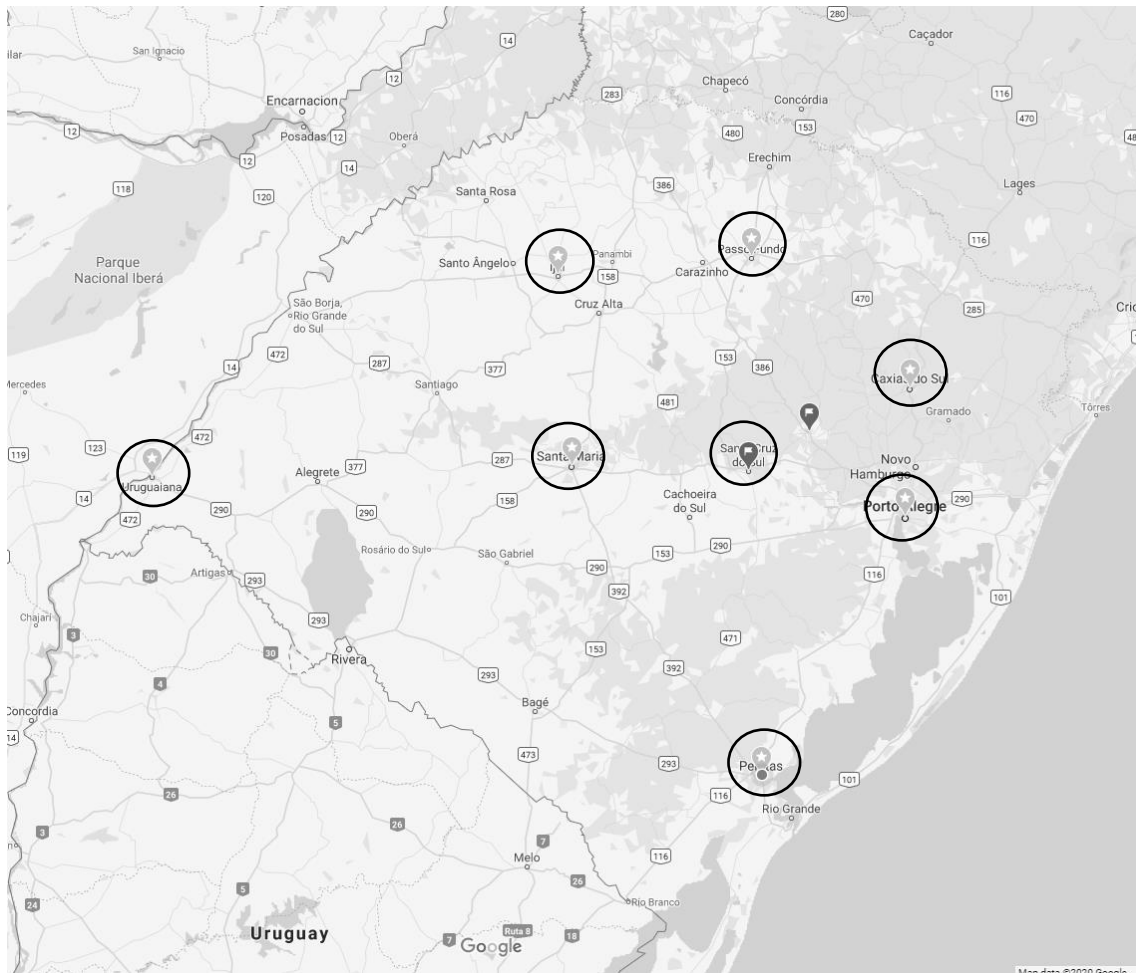
Figura 2. Mapa do Estado, com as cidades incluídas nos estudos sorológicos de base populacional sobre a prevalência de COVID-19 no Rio Grande do Sul.