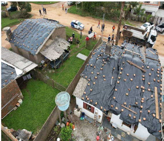
Figura 1: Milhares de casas foram destruídas pelo granizo