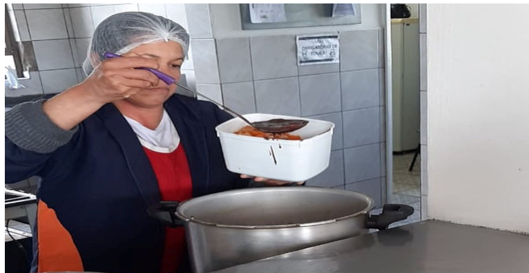
Figura 4: Distribuição de merendas escolares com as aulas suspensas