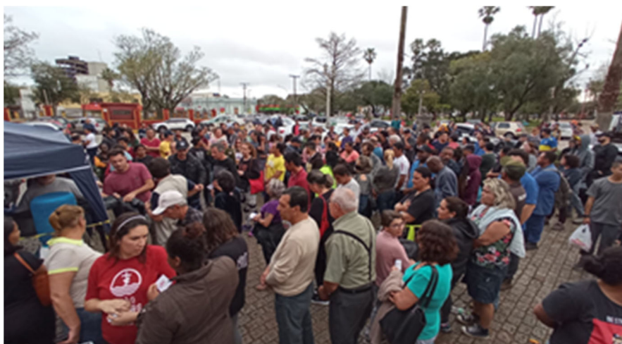
Figura 2: Retirada das lonas no centro administrativo