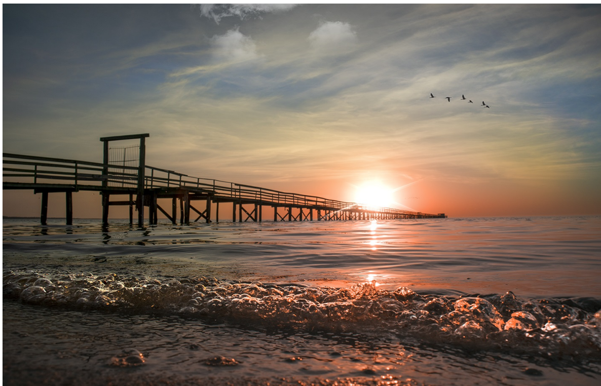
Lagoa dos Patos, Praia do Laranjal. Pelotas, Rio Grande do Sul.